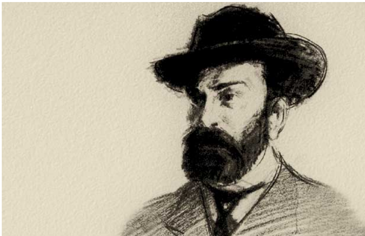
Ο Γεώργιος Βιζυηνός (1849- 1896) συνέθεσε το «Συναξάρι του Αγίου Κασσιανού», βασιζόμενος σε δημώδη καλογερική παράδοση σλαβικής προέλευσης («Ατθίδες Αύραι», 1884).

Αρχικά, ο Γιώργος Βιζυηνός συνέθεσε ένα μακροσκελές ποίημα 69 εξάστιχων στροφών σε μέτρο ιαμβικό οκτασύλλαβο («Συναξάρι Αγίου Κασσιανού», Ατθίδες Αύραι, 1884), περιγράφοντας τις ανατρεπτικές κινήσεις του Κασσιανού εν Ουρανοίς. Ο συγγραφέας βασίζει τον πυρήνα του όλου «σεναρίου» σε μια («αφελή») σλαβική παράδοση, σύμφωνα με την οποίαν ο Άγιος Νικόλαος είχε τέτοια υπέρμετρη φιλοδοξία που σκόπευε να ανατρέψει τον ίδιο τον Μεγαλοδύναμο από τον θρόνο του. Έτσι, ο Κασσιανός κατηγορεί ανοικτά πλέον τον Νικόλαο ότι καλλιεργεί «προσωπικές στρατηγικές» και ότι απουσιάζει συνέχεια από τον Παράδεισο προς άγραν δώρων (και ευαρέσκειας) από τους πιστούς. Οι χαλαροί ουράνιοι ρυθμοί διαταράσσονται και συγκαλείται αμελλητί ολομέλεια των Αγίων, όπου ακούγονται πολλές απόψεις. Εν κατακλείδι, προκύπτει με σαφήνεια ότι ο κυματόδαρτος Νικόλαος αποσκοπεί (προφανώς!) μόνον στο να βοηθάει τους κινδυνεύοντες ναυτικούς ανά τις θάλασσες, χωρίς να κάνει δεύτερες σκέψεις περί της Ιεραρχίας του Παραδείσου... Για αυτό το λόγο και λείπει νυχθημερόν από το κελί του! Όπως είναι φυσικό, με αυτές τις αποκαλύψεις ο Κασσιανός πέφτει σε δυσμένεια, το αίτημά του περί «κοινοκτημοσύνης» στα αναθήματα (αφιερώματα) των πιστών δεν εξετάζεται καν, ενώ έρχεται αντιμέτωπος και με το ενδεχόμενο οριστικής και αμετακλήτου διαγραφής του από τα ... Μητρώα των αγίων! Ευτυχώς όμως, ο Πλάστης και Δημιουργός σέβεται τη διαχρονική λαϊκή βούληση -όπως έχει διατυπωθεί μέσω της αγιοκατάταξης του Κασσιανού- και δεν του αφαιρεί την