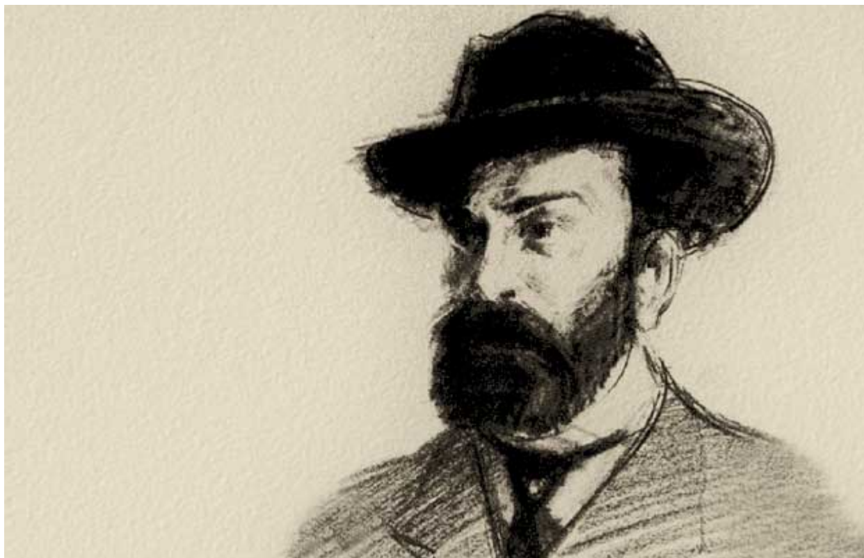
Ο Γεώργιος Βιζυηνός (1849- 1896) συνέθεσε το «Συναξάρι του Αγίου Κασσιανού», βασιζόμενος σε δημώδη καλογερική παράδοση σλαβικής προέλευσης («Αθτίδες Αύραι», 1884).

Αρχικά, ο Γιώργος Βιζυηνός συνέθεσε ένα μακροσκελές ποίημα 69 εξάστιχων στροφών σε μέτρο ιαμβικό οκτασύλλαβο («Συναξάρι Αγίου Κασσιανού», Αθτίδες Αύραι, 1884), περιγράφοντας τις ανατρεπτικές κινήσεις του Κασσιανού εν Ουρανοίς. Ο συγγραφέας βασίζει τον πυρήνα του όλου «σεναρίου» σε μια («αφελή») σλαβική παράδοση, σύμφωνα με την οποίαν ο Άγιος Νικόλαος είχε τέτοια υπέρμετρη φιλοδοξία που σκόπευε να ανατρέψει τον ίδιο τον Μεγαλοδύναμο από τον θρόνο του. Έτσι, ο Κασσιανός κατηγορεί ανοικτά πλέον τον Νικόλαο ότι καλλιεργεί «προσωπικές στρατηγικές» και ότι απουσιάζει συνέχεια από τον Παράδεισο προς άγραν δώρων (και ευαρέσκειας) από τους πιστούς. Οι χαλαροί ουράνιοι ρυθμοί διαταράσσονται και συγκαλείται αμελλητί ολομέλεια των Αγίων, όπου ακούγονται πολλές απόψεις. Εν κατακλείδι, προκύπτει με σαφήνεια ότι ο κυματόδαρτος Νικόλαος αποσκοπεί (προφανώς!) μόνον στο να βοηθάει τους κινδυνεύοντες ναυτικούς ανά τις θάλασσες, χωρίς να κάνει δεύτερες σκέψεις περί της Ιεραρχίας του Παραδείσου... Για αυτό το λόγο και λείπει νυχθημερόν από το κελί του! Όπως είναι φυσικό, με αυτές τις αποκαλύψεις ο Κασσιανός πέφτει σε δυσμένεια, το αίτημά του περί «κοινοκτημοσύνης» στα αναθήματα (αφιερώματα) των πιστών δεν εξετάζεται καν, ενώ έρχεται αντιμέτωπος και με το ενδεχόμενο οριστικής και αμετακλήτου διαγραφής του από τα ... Μητρώα των αγίων! Ευτυχώς όμως, ο Πλάστης και Δημιουργός σέβεται τη διαχρονική λαϊκή βούληση -όπως έχει διατυπωθεί μέσω της αγιοκατάταξης του Κασσιανού- και δεν του αφαιρεί την