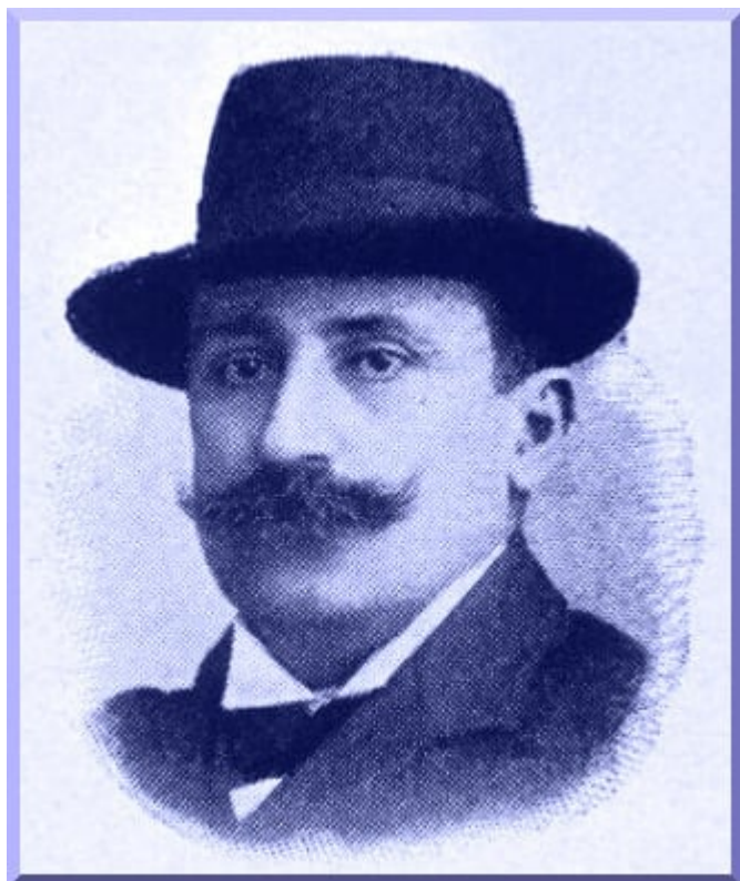
Ο Ηπειρώτης Χρήστος Χρηστοβασίλης (1861 - 1937) έγραψε το διήγημα «Ο Άγιος Κασσιανός» («Ημερολόγιον Σκόκου», 1903).