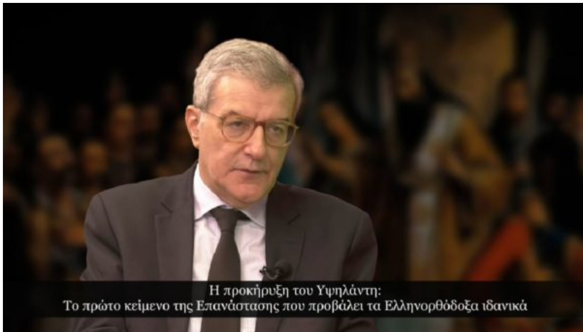
Η προκήρυξη του Υψηλάντη: Το πρώτο κείμενο της Ελανάστασης που προβάλλει τα Ελληνορθόδοξα ιδανικά