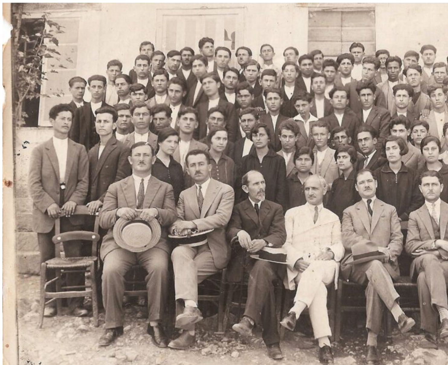
Φωτογραφία από τη Μεσσηνία του 1930.