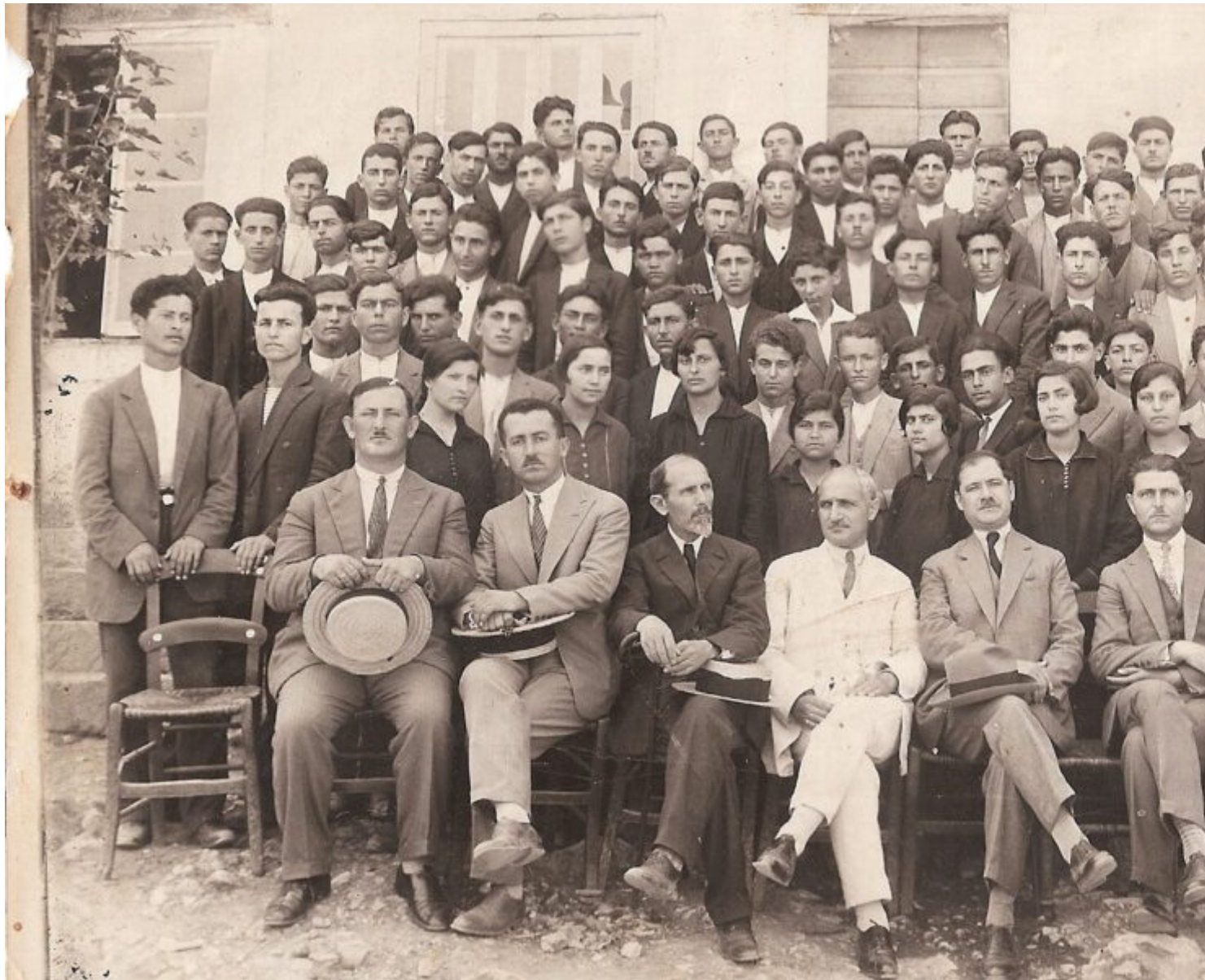
Φωτογραφία από τη Μεσσηνία του 1930.