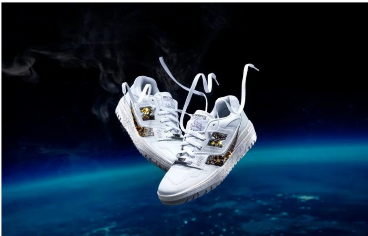
Τα περφόρμα συλλεκτικά sneakers της New Balance που είναι φτιαγμένα με πολύτιμα πετρώματα από αληθινό μετεωρίτη.