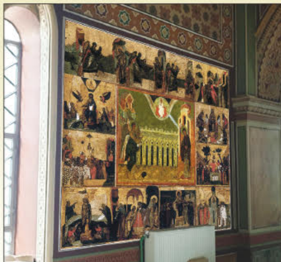
Φωτορεαλιστική απεικόνιση της παράστασης του Ευαγγελισμού της Θεοτόκου, η οποία πλαισιώνεται από δώδεκα (12) οίκους του Ακαθίστου Ύμνου.

Πληροφορίες στην Γραμματεία του Πνευματικού Κέντρου, στο τηλέφωνο 210 4125619, καθημερινά 8.30 π.μ.- 4.00 μ.μ.