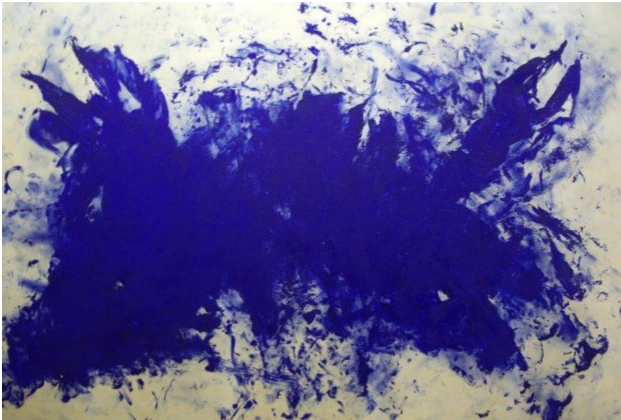
Yves Klein, La grande Anthropométrie bleue, 1960.

Πριν από το 1703 το μπλε χρώμα κόστιζε περισσότερο και από χρυσάφι, με αποτέλεσμα πολλοί ζωγράφοι να ζητούν από τους πλούσιους πελάτες τους να τους το αγοράζουν προκαταβολικά. Αυτό άλλαξε μετά το 1703, όταν ένα νέο μπλε ανακαλύφθηκε τυχαία στο Βερολίνο. Ένας κατασκευαστής μπογιάς, προσπαθώντας να δημιουργήσει μια παραγγελία κόκκινου χρώματος, πειραματίστηκε με την οξείδωση του σιδήρου, με αποτέλεσμα η χημική αντίδραση να δώσει ένα φωτεινό μπλε. Κάπως έτσι, το επονομαζόμενο Πρώσικο Μπλε, άρχισε να είναι εύκολα προσβάσιμο στους καλλιτέχνες και έγινε εξαιρετικά δημοφιλές στην τέχνη και στη μόδα για τους επόμενους αιώνες.