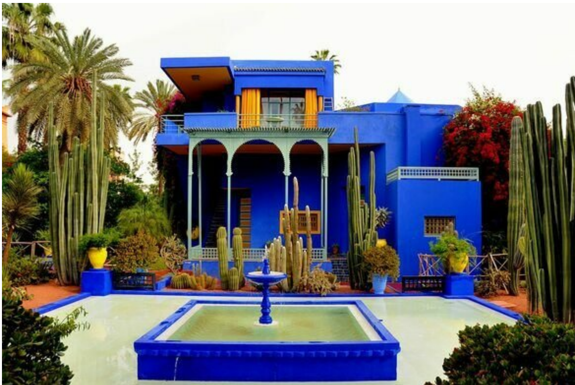
Η μπλε Majorelle βίλα στο Morocco.

«Το μπλε είναι το χρώμα της υπέρβασης, μας οδηγεί μακριά, στην αναζήτηση του άπειρου», έγραψε ο William Gass στο βιβλίο του «On Being Blue: A Philosophical Inquiry», ενώ σύμφωνα με τον Wassily Kandinsky «η δύναμη της βαθιάς έννοιας βρίσκεται στο μπλε [...] Το μπλε είναι το τυπικό ουράνιο χρώμα».