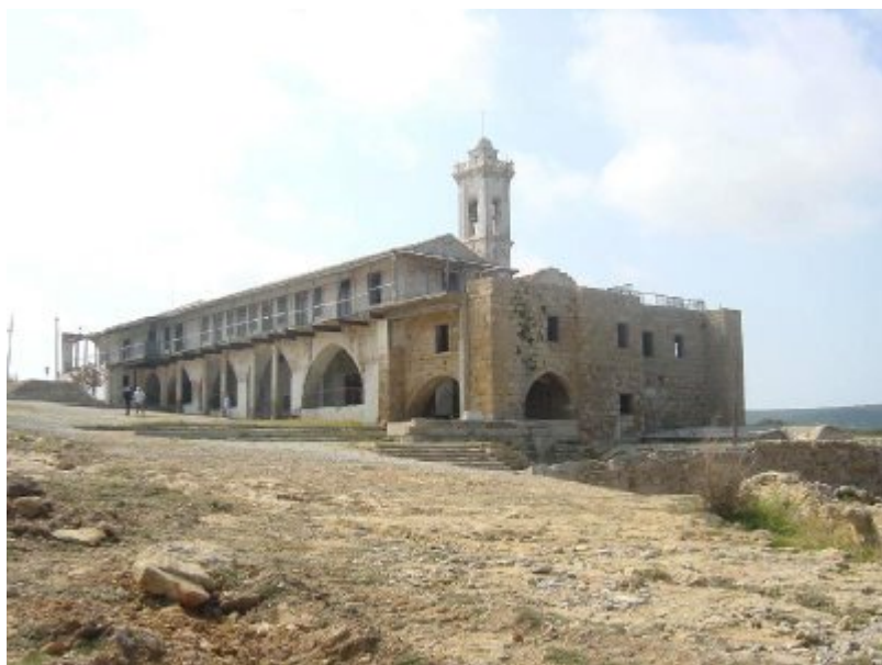
Το ιστορικό Μοναστήρι του Αγίου Ανδρέα σήμερα, έρημο και μόνο, στην κατεχόμενη από Τούρκους Καρπάσια...

Για την ίδρυση του φημισμένου Μοναστηριού του Αποστόλου Ανδρέα, που βρίσκεται στο ομώνυμο ακρωτήριο στην κατεχόμενη Καρπάσια, ελάχιστα είναι γνωστά. Η παράδοση φέρει τον Απόστολο Ανδρέα να έχει περάσει από το μέρος εκείνο, τον 1ο αιώνα μ.Χ., όταν το καράβι με το οποίο ταξίδευε έμεινε αγκυροβολημένο για τρεις ημέρες σε παρακείμενο λιμανάκι λόγω νηνεμίας.