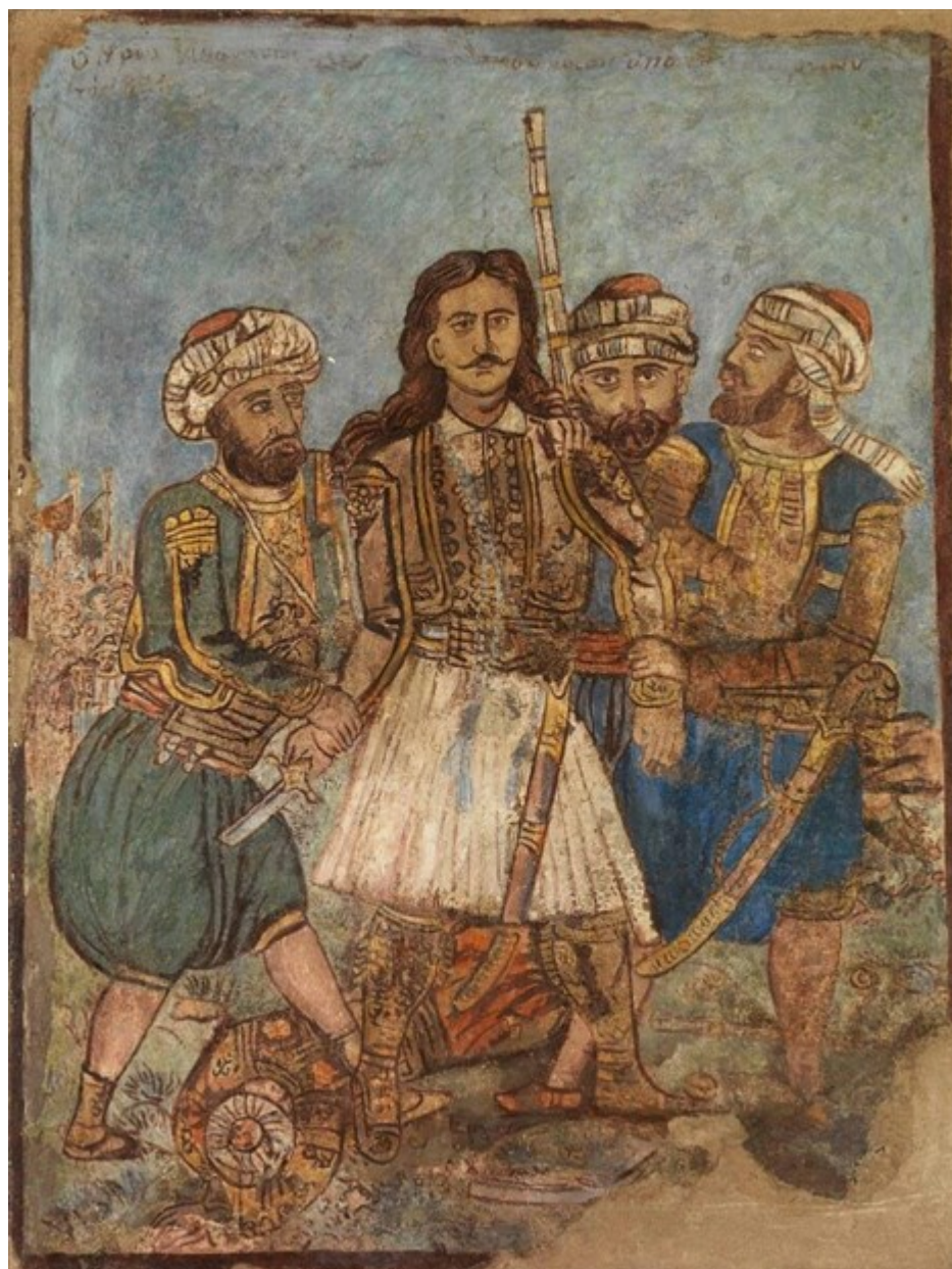
«Αθανάσιος Διάκος», 1931. Αποτοίχιση, 124 x 94 εκ. Συλλογή Ανωτάτης Σχολής Καλών Τεχνών

Η έκθεση «Θεόφιλος. Ο Τσολιάς της Ζωγραφικής» πραγματοποιείται στο πλαίσιο των δράσεων της Πρωτοβουλίας '21, των 16 Ιδρυμάτων, για τον εορτασμό της επετείου των 200 χρόνων από την Επανάσταση και, όπως τονίζει ο Στρατής Ελευθεριάδης-Teriade: «Όταν ο Θεόφιλος ζωγραφίζει ήρωες του '21, οι φουστανέλες γίνονται λουλούδια στους αγρούς. Όταν ζωγραφίζει δάση πολύφυλλα εκφράζει με την πράσινη ποικιλία των όλη τη λαχτάρα ενός αγρότη για το νερό. Όταν ζωγραφίζει σκηνές από την καθημερινή ζωή, φτάνει στη συνθετική και χρωματική ενότητα των πιο σοφών ζωγράφων».