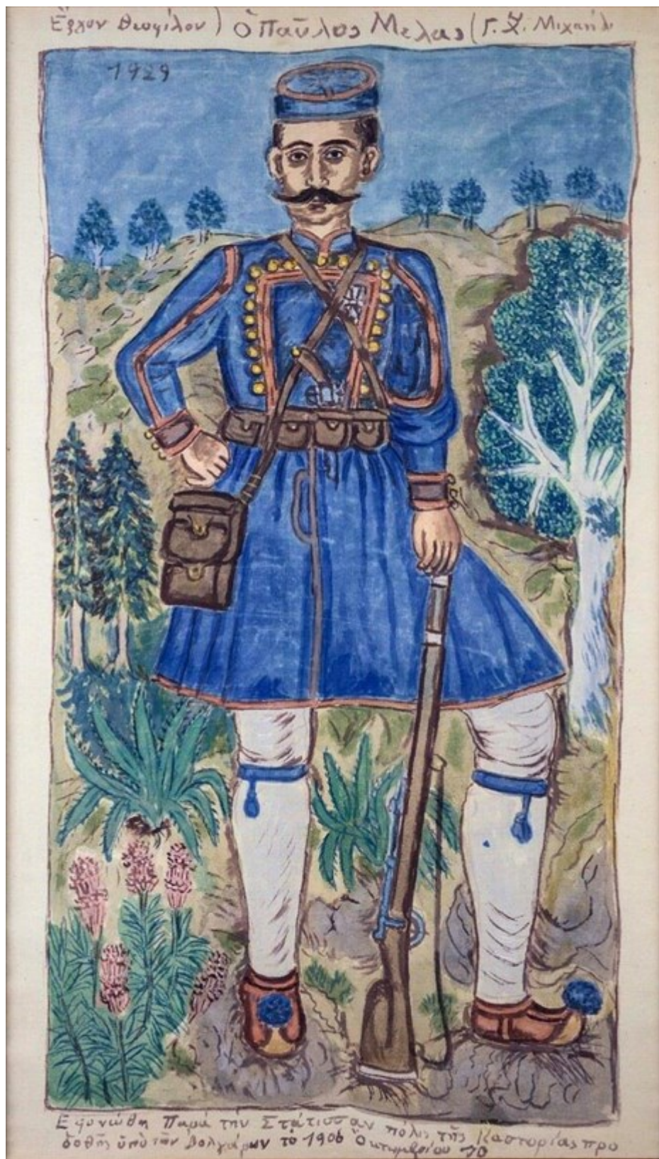
«Ὁ Παῦλος Μελας Ἐφρονέθη παρὰ τὴν Στάτισσαν πόλιν τῆς Καστορίας προδοθῆς ὑπὸ τῶν βολγάρων τὸ 1906 Ὀκτωβρίου 10», 1929. Ζωγραφικὴ σε υπόλευκο βαμβακερὸ ὕφασμα, 120 x 71 εκ.. Συλλογὴ Μουσείου Θεοφίλου, Δήμου Μυτιλήνης