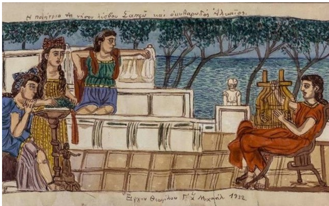
«Ἡ ποιήτρια τῆς νήσου λέσβου Σαπφῶ καὶ ὁ κυθαρωδὸς Ἀλκαῖος», 1932. Ζωγραφικὴ σε υπόλευκο βαμβακερὸ ὕφασμα, 72,5 x 176,6 εκ. Συλλογὴ Μουσείου Θεόφιλου, Δήμου Μυτιλήνης

Ἡ ἐκθεση θα διαρκέσει ἕως τις 3 Φεβρουαρίου 2022 καὶ θα συνοδεύεται ἀπὸ πολυσέλιδο ομότιτλο κατάλογο, με ὅλα τα ἐκτιθέμενα ἔργα, καθὼς καὶ κείμενα τῶν Στρατῆ Ἐλευθεριάδη-Τεριάδη, Ὀδυσσεά Ἐλύτη, Γιώργου Σεφέρη, Τάκη Μαυρωτά καὶ τῶν ἐπιφανῶν ζωγράφων Ἀλέξη Βερούκα, Στέφανου Δασκαλάκη, Χρήστου Μποκόρου, Γιώργου Ρόρρη.