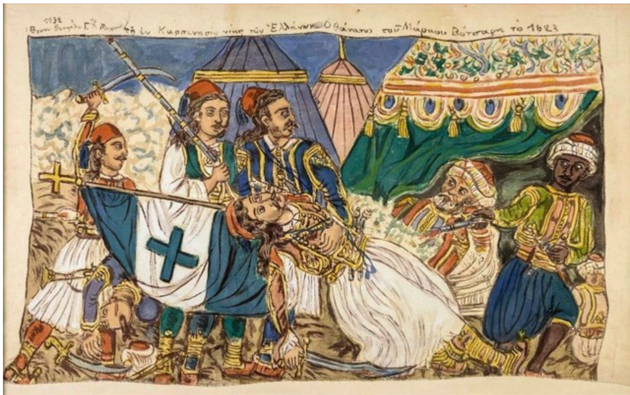
«Τῆ ἐν Καρπενησίῳ νίκη τῶν Ἑλλήνων. Ὁ θάνατος τοῦ Μάρκου Βότσαρη τὸ 1823», 1932. Ζωγραφικὴ σε ὑπόλευκο βαμβακερὸ ὕφασμα, 77,5 x 121 εκ. Συλλογὴ Μουσείου Θεόφλου, Δήμου Μυτιλήνης

Ενενηντὰ ἕξι πολῦτιμα ἔργα τοῦ Θεόφλου, δανεισμένα ἀπὸ τις συλλογές τοῦ Μουσείου Θεόφλου-Δήμου Μυτιλήνης, τῆς Εθνικῆς Πινακοθήκης, τῆς Α.Σ.Κ.Τ., τῆς Βουλῆς τῶν Ἑλλήνων, τῆς Alpha Bank, τοῦ Μακεδονικοῦ Μουσείου Σύγχρονης Τέχνης, τοῦ Μουσείου Νεοελληνικῆς Τέχνης Δήμου Ρόδου, τῆς Εταιρείας Λεσβιακῶν Μελετῶν καὶ ἀπὸ τους συλλέκτες κ. Ευάγγελο καὶ κα Κατίγκω Αγγελάκου, κ. Ευάγγελο Μυτιληναῖο, κ. Μπάμπο καὶ κα Ἄντζελα Οικονομίδη, κα Μαρίνα Ηλιάδη, κ. Μανῶλη Περαιτικό καὶ ἄλλους, ολοκληρώνουν τὴ φυσιογνωμία τῆς μεγάλης αὐτῆς ἐκθεσης. Συγκεκριμένα, σαράντα δύο αντιπροσωπευτικὰ ἔργα τοῦ Θεόφλου προέρχονται ἀπὸ τὸ Μουσεῖο Θεόφλου, ἀπὸ τὴν περίφημη δωρεὰ τοῦ Στρατῆ Ελευθεριάδη-Τερίαδη, ὁ ὁποῖος ἰδρυσε στὴ Μυτιλήνη τὸ Μουσεῖο Θεόφλου καὶ τὸ Μουσεῖο Βιβλιοθήκη Στρατῆ Ελευθεριάδη-Τερίαδη, τὰ ὁποῖα ἐμπλούτισε με σημαντικὰ ἔργα τέχνης καὶ ἐκδόσεις που ταυτίζονται με τὸ βλέμμα καὶ τις αισθητικὲς ἐπιλογές τοῦ καταξιωμένου τεχνοκριτικοῦ καὶ ἐκδότη