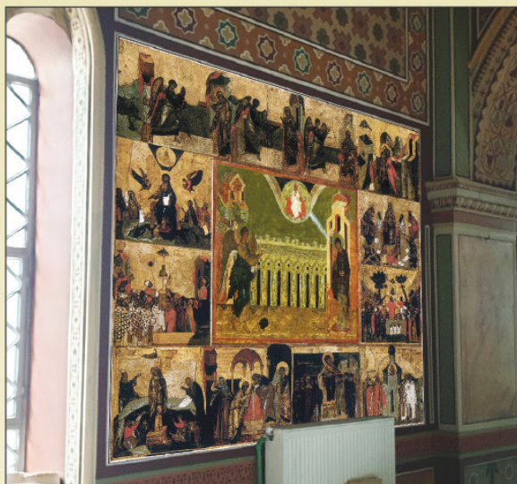
Φωτορεαλιστική απεικόνιση της παράστασης του Ευαγγελισμού της Θεοτόκου, η οποία πλαισιώνεται από δώδεκα (12) οίκους του Ακαθίστου Ύμνου.

Πληροφορίες στην Γραμματεία του Πνευματικού Κέντρου, στο τηλέφωνο 210 4125619, καθημερινά 8.30 π.μ.- 4.00 μ.μ.