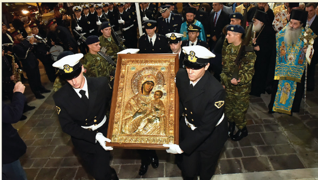
Στιγμιότυπα από την υποδοχή της «Παναγίας Βηματάρισσας» από την Ιερά Μεγίστη Μονή Βατοπαιδίου στην Ευαγγελίστρια Πειραιώς.

Το δεύτερο θαύμα συνδέεται με τον Ιερό Ναό Ευαγγελιστρίας Πειραιώς, που ανηγέρθη τα τέλη του 19ου αι., προκειμένου να εξυπηρε-