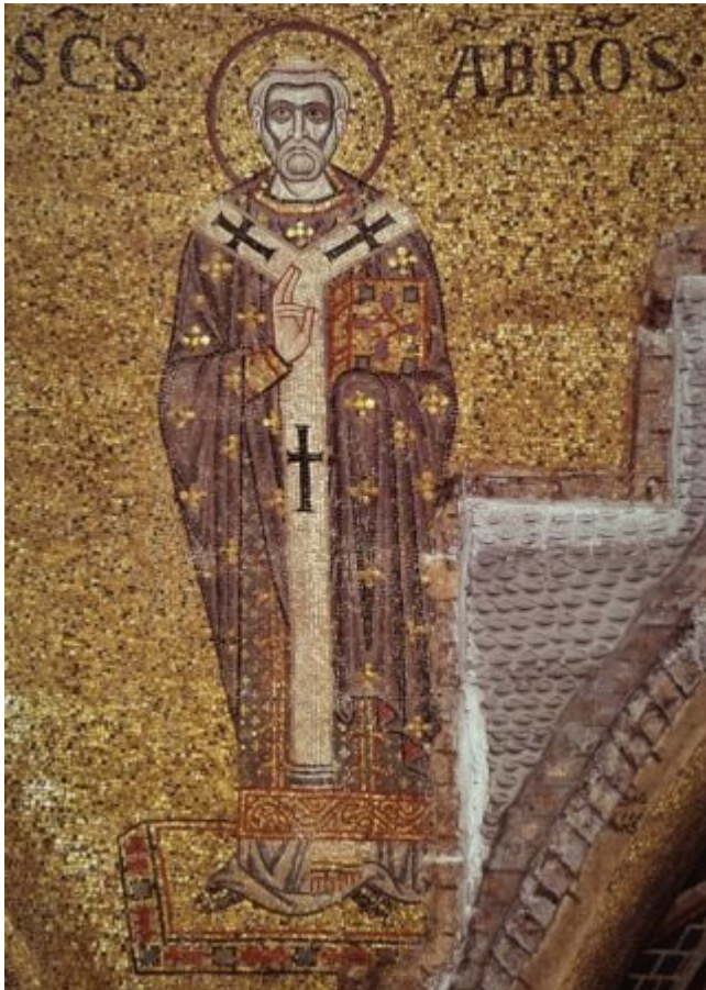
Άγιος Αμβρόσιος Επίσκοπος Μεδιολάνων.