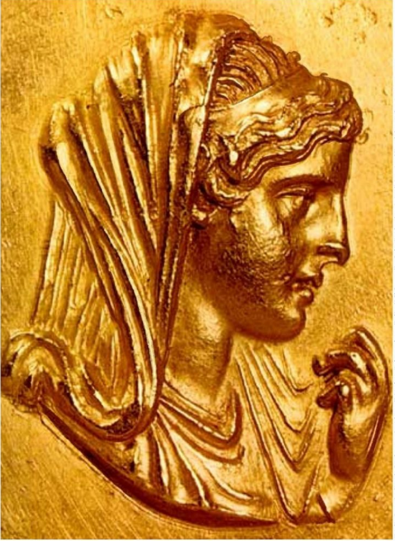
Μυρτιά, Στρατονίκη, Ολυμπιάς, Γρηγόριας του Βασιλείου των Μολοσσών της Ηπείρου, μητέρα του Μεγάλου Αλεξάνδρου της Μακεδονίας, Χρυσό περίπλοτο (φωλακτό), Αρχαιολογικό Μουσείο Θεσσαλονίκης