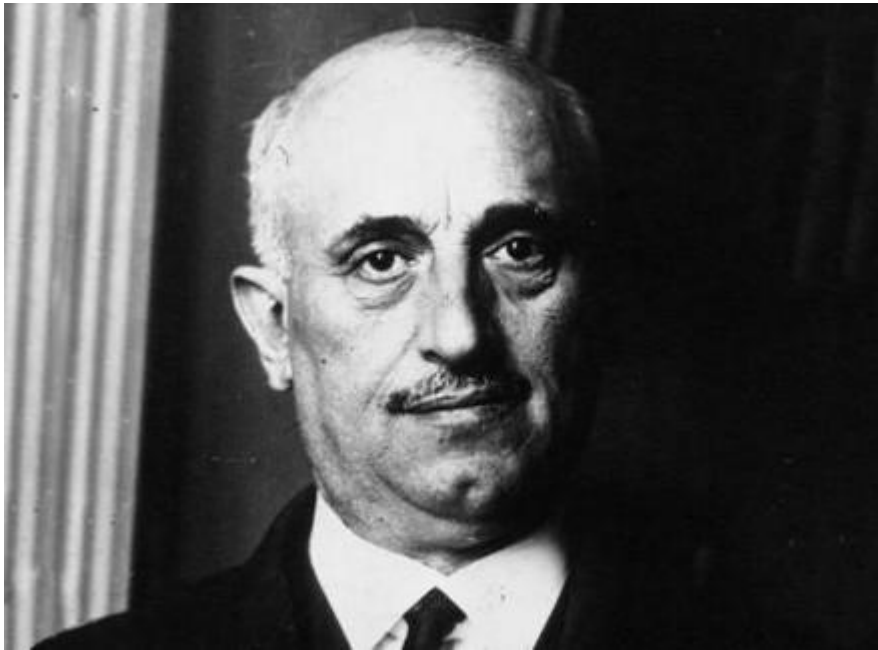
Αλέξανδρος Παπαναστασίου (1876 - 1936)

Αρκάς νομικός και κοινωνιολόγος, από τις σημαντικότερες πολιτικές προσωπικότητες της νεώτερης Ελλάδας.