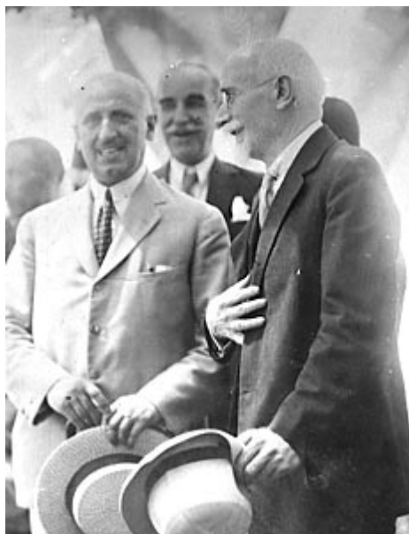
Ο Αλέξανδρος Παπαναστασιου και ο Ελευθέριος Βενιζέλος

Με την έκρηξη του Α΄ Βαλκανικού Πολέμου στρατεύτηκε ως εθελοντής και τιμήθηκε με μετάλλια για την πολεμική του δράση. Στις εκλογές της 31ης Μαΐου 1915 το Λαϊκό Κόμμα εντάχθηκε στο Κόμμα των Φιλελευθέρων του Ελευθερίου Βενιζέλου, αποτελώντας την αριστερή του πτέρυγα. Ακολούθησε τον Ελευθέριο Βενιζέλο στο κίνημα της Εθνικής Αμύνης (Εθνικός Διχασμός) και τον Μάρτιο του 1917 με την ανάληψη της εξουσίας από τον κρητικό πολιτικό, διορίστηκε κυβερνητικός αντιπρόσωπος στα Ιόνια Νησιά. Τον Ιούνιο του ίδιου χρόνου ανέλαβε το Υπουργείο Συγκοινωνίας έως τον Νοέμβριο του 1920, ενώ διατέλεσε ταυτόχρονα προσωρινός Υπουργός Περιθάλψεως και Εσωτερικών.