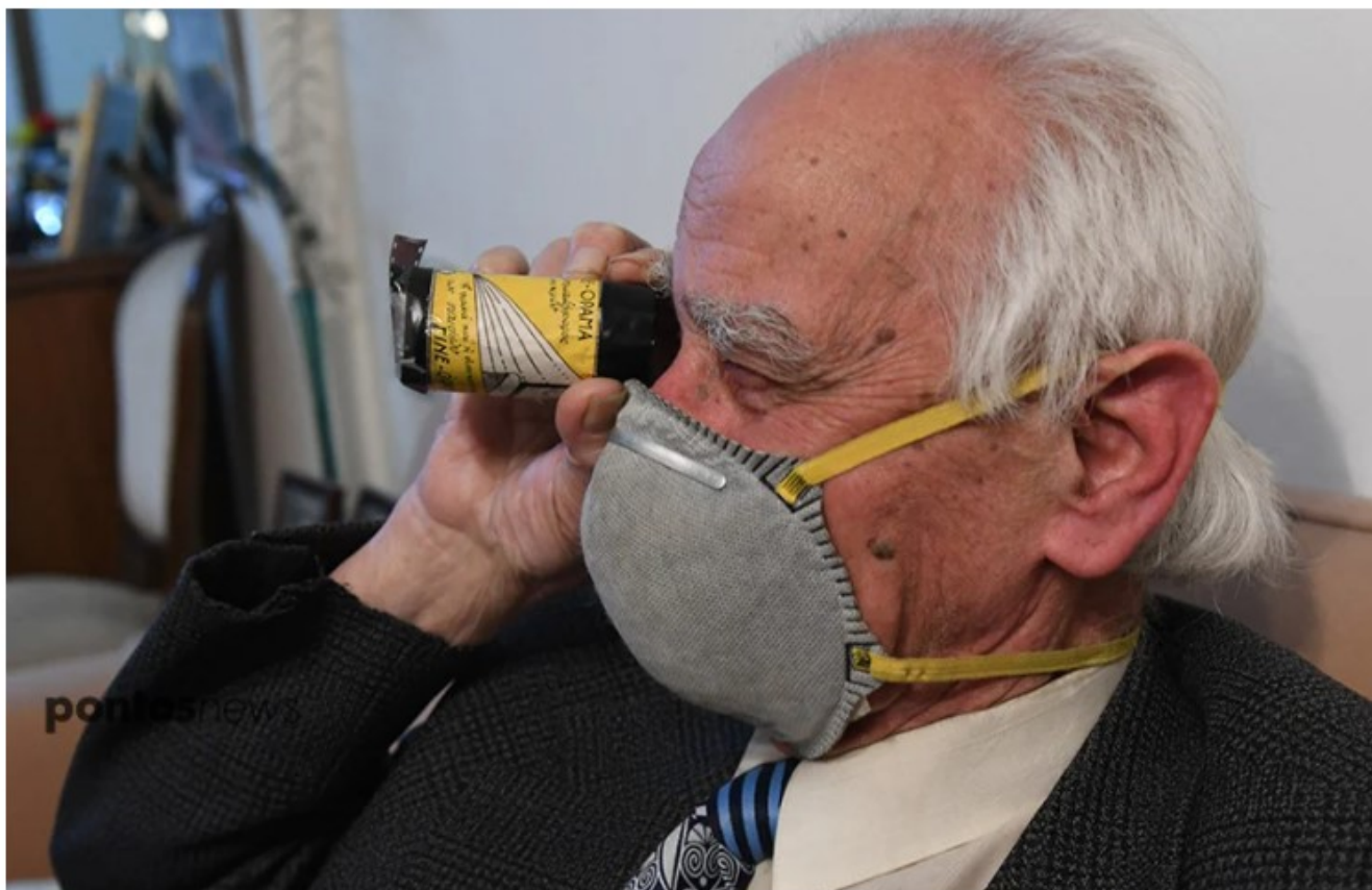
Με τη λούπα βλέπει αρνητικό ταινίας

Συνολικά ο Νίκος Μπιλιλής έγραψε δώδεκα θεατρικά έργα (οπερέτες, πρόζες και επιθεωρήσεις, με μουσική δική του σε όλα), πέντε μεγάλου μήκους κινηματογραφικές ταινίες, σαράντα ντοκιμαντέρ, δεκάδες χιλιάδες θέματα κινηματογραφικών επικαίρων. Επίσης, έχει συμμετάσχει με ταινίες του σε διεθνή φεστιβάλ κινηματογράφου και έχει αποσπάσει διακρίσεις, με ίσως κορυφαία στιγμή τη συμμετοχή του το 2007 στο 61ο Διεθνές Φεστιβάλ Κινηματογράφου του Σαλέρνου, με το αντιπολεμικό ντοκιμαντέρ Κοιμισμένοι λαοί επιτέλους ξυπνήστε, το οποίο απέσπασε διθυραμβικές κριτικές