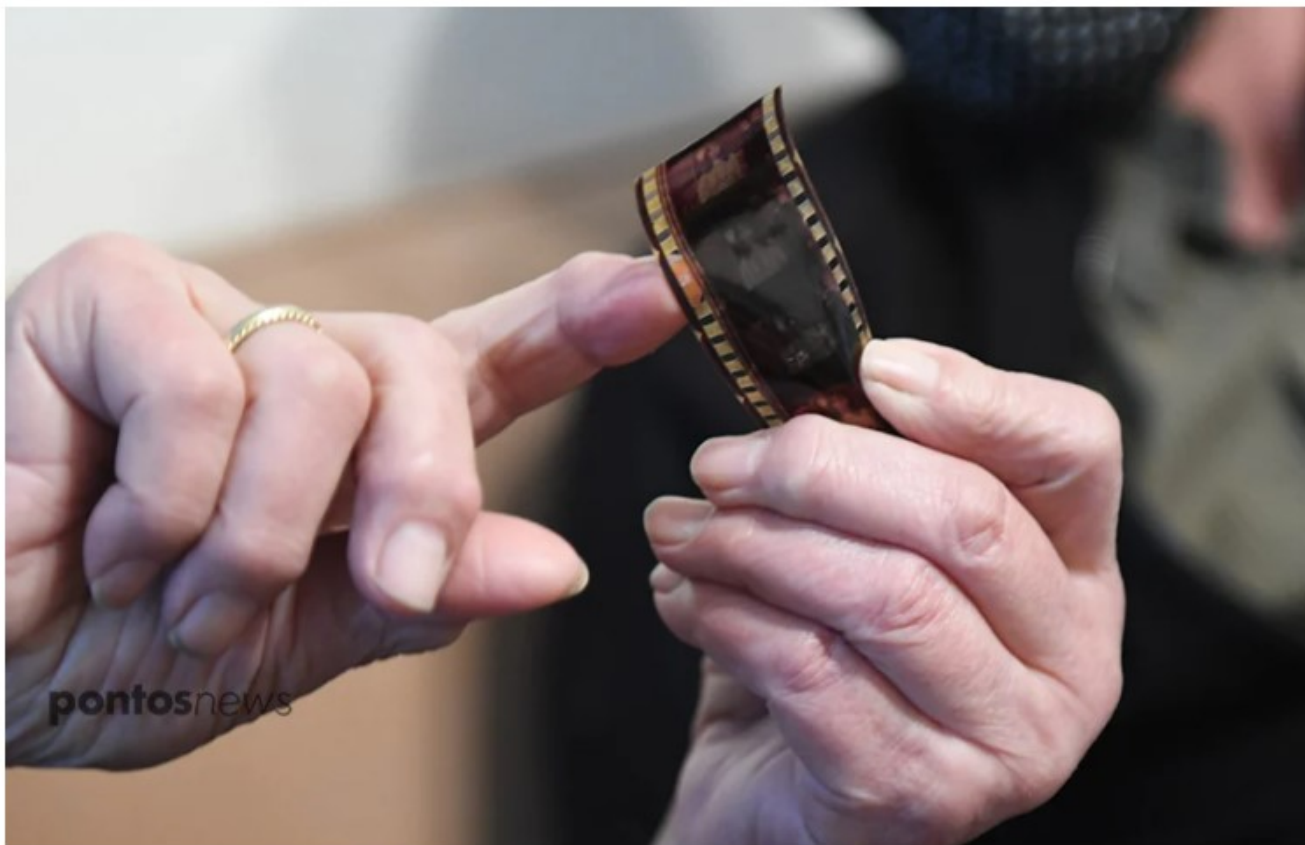
Παλιό αρνητικό ταινίας

Ένα πρωινό είδε κάποιους συμμαθητές του να παίζουν κορώνα-γράμματα με τετράδες - τμήματα από τα φιλμ του βουβού κινηματογράφου. «Ήθελα κι εγώ να παίξω μαζί τους. Έτσι, πήγα στο ψιλικατζίδικο και αγόρασα δύο πήχεις τετράδων. Είχα ποικιλία από εικόνες, διότι οι τετράδες μου προέρχονταν από διαφορετικές ταινίες», θυμάται.