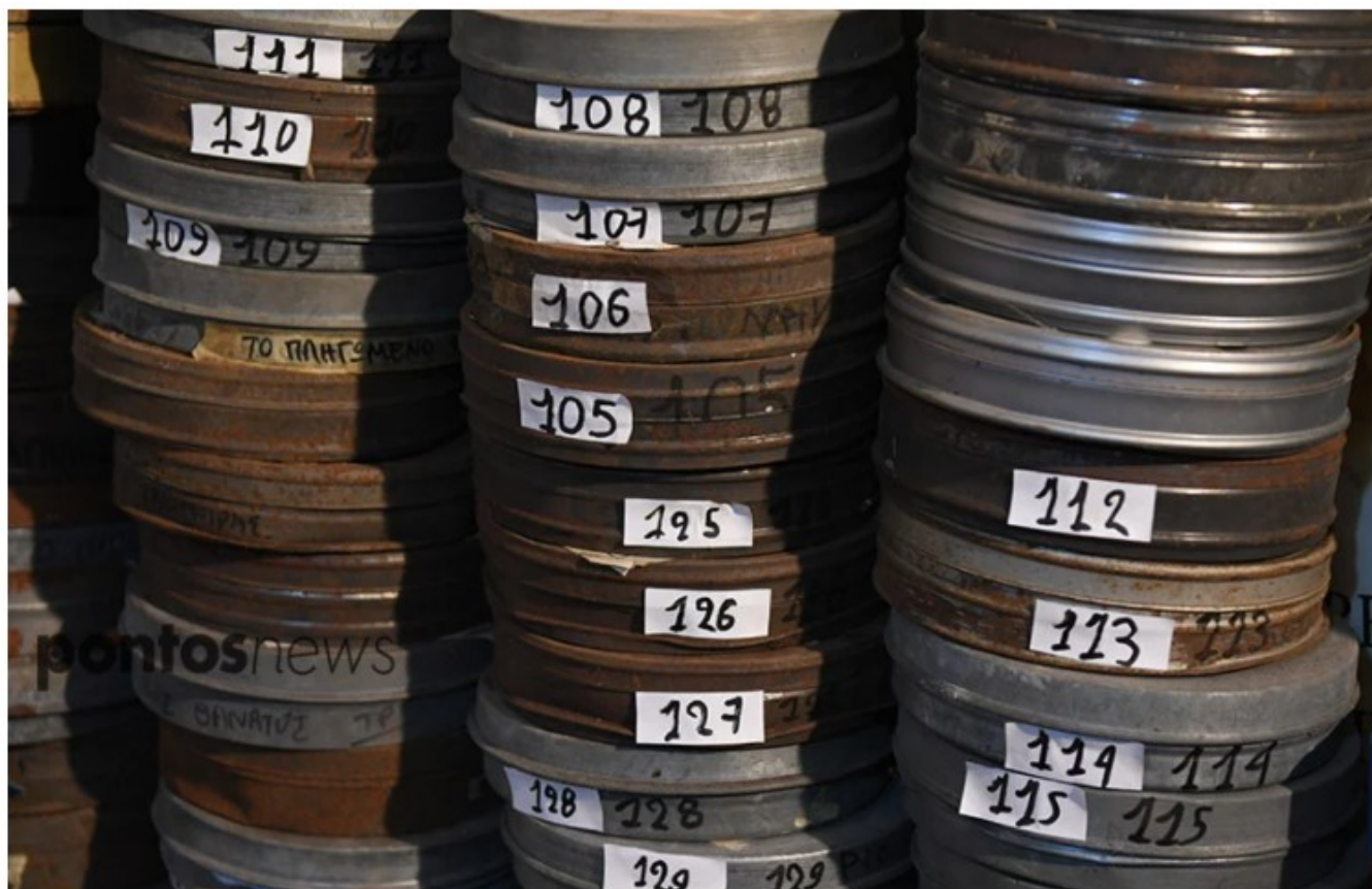
Παλιές μπομπίνες