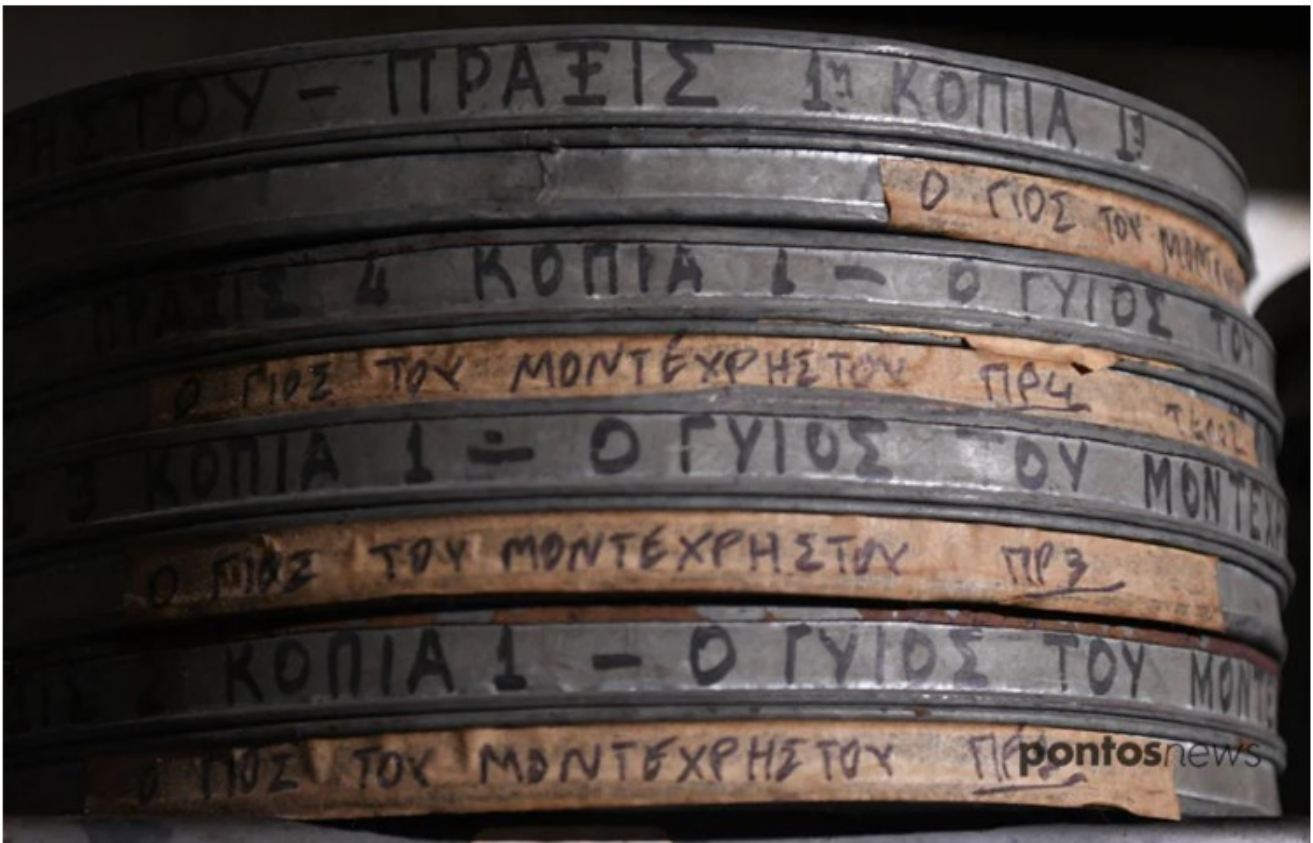
Παλιές μπομπίνες

Σαλέρνου, με το αντιπολεμικό ντοκιμαντέρ Κοιμισμένοι λαοί επιτέλους ξυπνήστε, το οποίο απέσπασε διθυραμβικές κριτικές