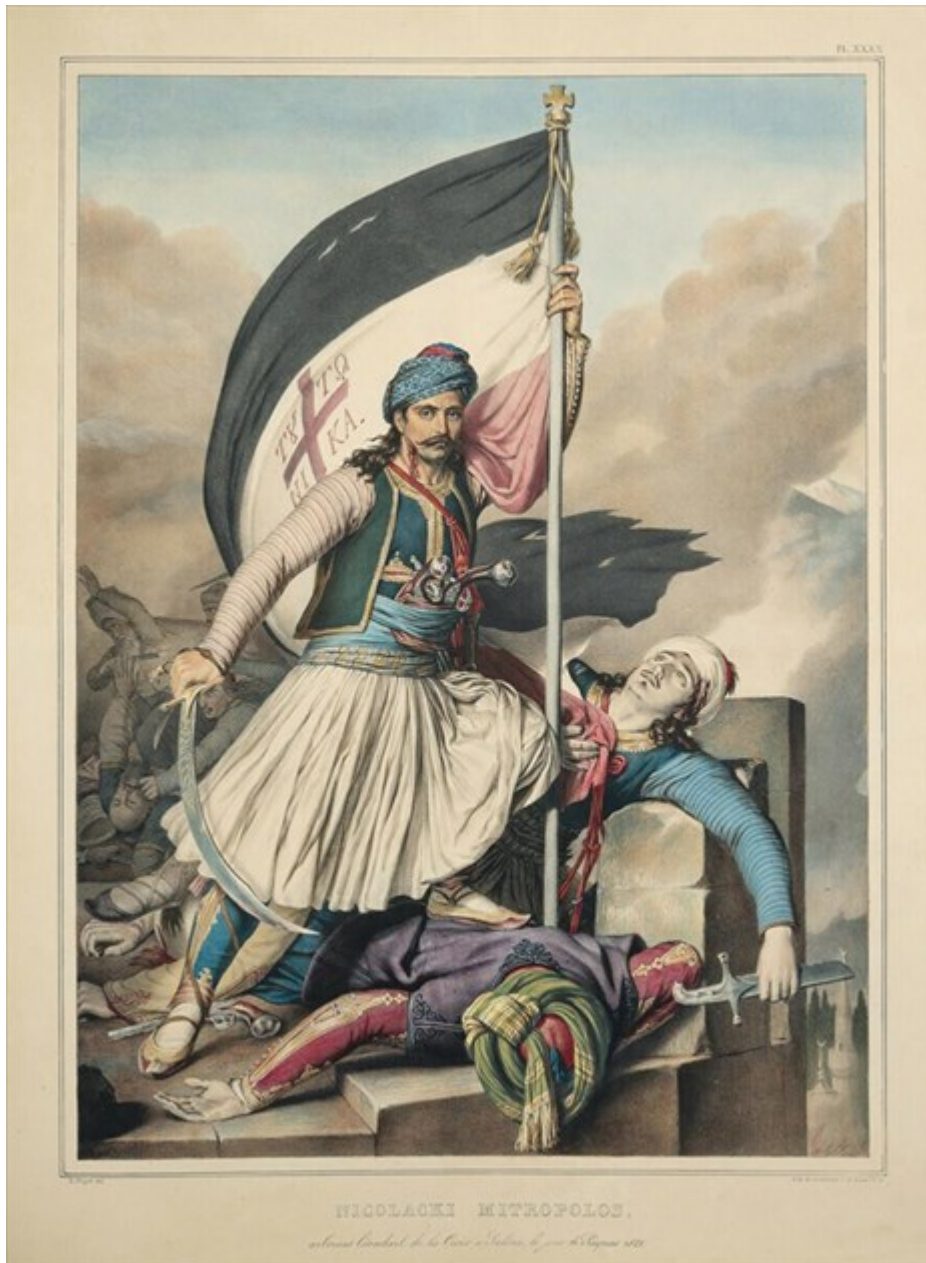
Louis Dupré, πρώτη έκδοση του Voyage à Athènes et à Constantinople, 40 επιχρωματισμένες λιθογραφίες. Τιμή εκτίμησης € 40.000 - 60.000

Μεγάλο ιστορικό ενδιαφέρον παρουσιάζει, επίσης, μια αυτόγραφη Επιστολή υποστήριξης της Κρητικής Επανάστασης (9 Φεβρουαρίου 1867) του σπουδαίου Γάλλου ποιητή και φιλέλληνα Victor Hugo, που εντάσσεται στην προσπάθειά του να στηρίξει τους επαναστατημένους Κρητικούς την περίοδο της Κρητικής Επανάστασης του 1866, που υπήρξε από τις πλέον σημαντικές επαναστάσεις ενάντια στην οθωμανική κυριαρχία.