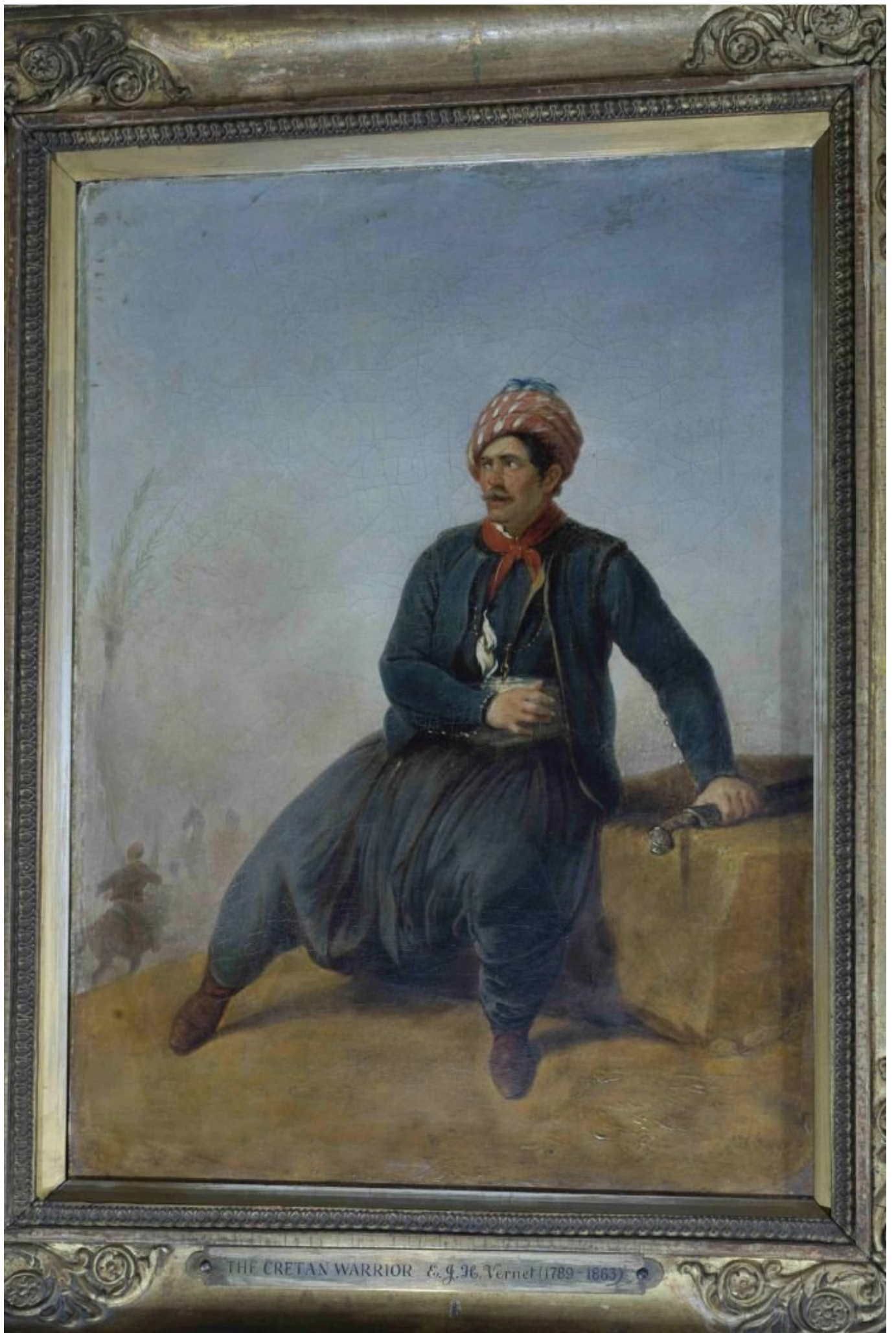
THE CRETAN WARRIOR E. J. H. Vernet (1789-1863)