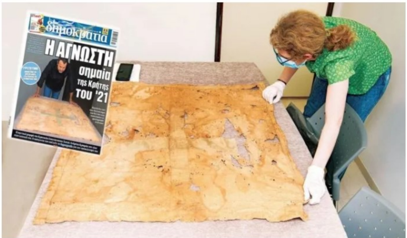
Η σημαία της Κρήτης.

Το ιερό πολεμικό λάβαρο της Κρήτης βρισκόταν τα τελευταία 191 χρόνια στη Σύρο, όπου μεταφέρθηκε από τον πρόεδρο της Καγκελαρίας Σφακίων Χατζή Ανδρέα Κριαρά το 1830, μετά το άδοξο τέλος της Κρητικής Επανάστασης, που επιφύλαξε η υπογραφή του πρωτοκόλλου του Λονδίνου. Έκτοτε βρισκόταν κλειδαμπαραωμένη στην οικία της οικογένειας στο κυκλαδονήσι και δεν εκτέθηκε ποτέ σε δημόσια θέα, τουλάχιστον τον τελευταίο αιώνα. Μέχρι σήμερα κανείς δεν την έχει δει, ούτε περιγράψει.