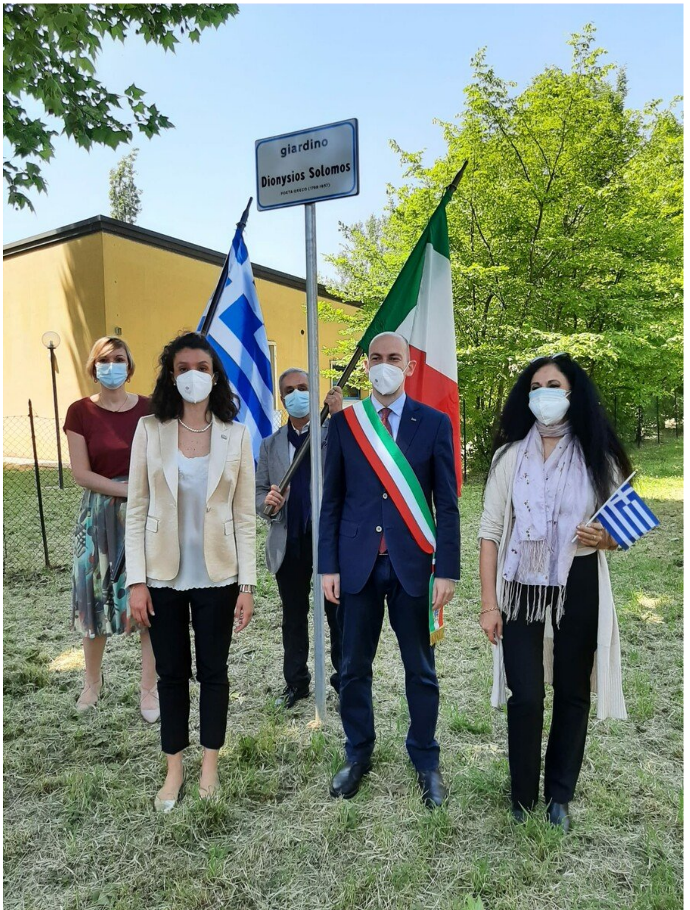
Ολοκληρώνοντας τον χαιρετισμό του, ο κ. Χρυσουλάκης συνεχάρη την ελληνική