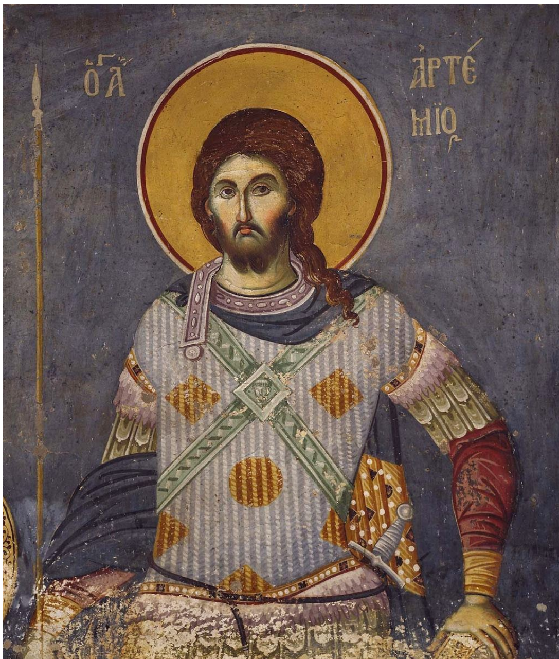
Ο άγιος Μεγαλομάρτυς Αρτέμιος.

Σήμερα η Εκκλησία εορτάζει και τιμά την ιερή μνήμη του αγίου και ενδόξου μεγαλομάρτυρα Αρτεμίου. Ο άγιος Αρτέμιος ήταν στρατιωτικός στα χρόνια του Μεγάλου Κωνσταντίνου. Για την αρετή του και τις άλλες ικανότητές του, ο πρώτος χριστιανός αυτοκράτορας τον ανέβασε στα ανώτατα κρατικά αξιώματα και στα 330 ο Αρτέμιος ήταν Αυγουστάλιος, δηλαδή μικρός αύγουστος και βασιλέας της Αλεξάνδρειας και της Αιγύπτου. Όταν ο διάδοχος του Μεγάλου Κωνσταντίνου Κωνσταντίος, που ήταν αρειανός, εδίωκε τον άγιο Αθανάσιο και ήθελε να τον συλλάβει, ο άγιος Αρτέμιος διευκόλυνε τον μεγάλο πρόμαχο της Ορθοδοξίας να φύγει και να κρυφτεί στα μοναστήρια της Αιγύπτου.