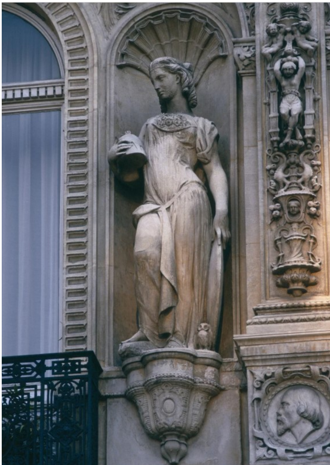
Η «Νέα Αθήνα» αποτελεί νευραλγικό κέντρο του καλλιτεχνικού Παρισιού στη Δεξιά Όχθη του Σηκουάνα

Οι μεγάλοι καλλιτέχνες που έζησαν στη Νέα Αθήνα Η καρδιά της «Νέας Αθήνας» βρίσκεται στην Πλας ντ' Ορλεάν (Place d'Orléans), η οποία ονομάστηκε έτσι προς τιμήν του βασιλιά Λουδοβίκου-Φιλίππου (Louis-Philippe), δούκα της Ορλεάνης. Το 1829 διαμορφώθηκε αρχιτεκτονικά σε ενιαίο