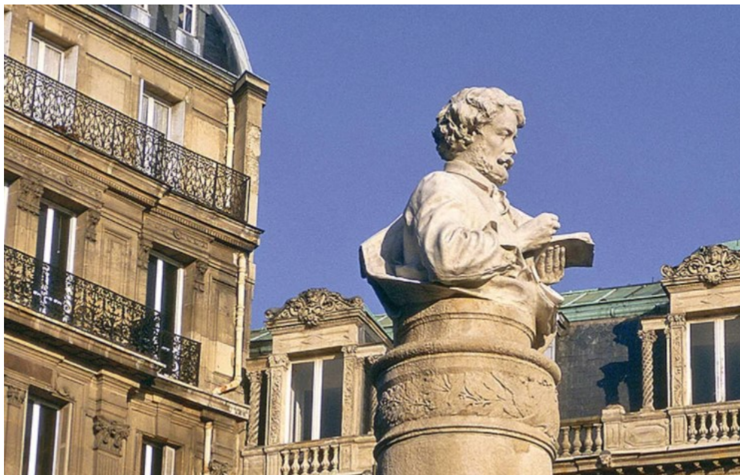
Παρίσι, 9ο διαμέρισμα, συνοικία Νέα Αθήνα, Place Saint Georges

Το όνομα της Αθήνας έχει ταξιδέψει πέρα από τον Ατλαντικό Ωκεανό, φτάνοντας μέχρι τις ΗΠΑ, τη Λατινική Αμερική και φυσικά την Ευρώπη. Ανάμεσα στις ευρωπαϊκές χώρες που χρησιμοποίησαν το όνομά της είναι και η Γαλλία.