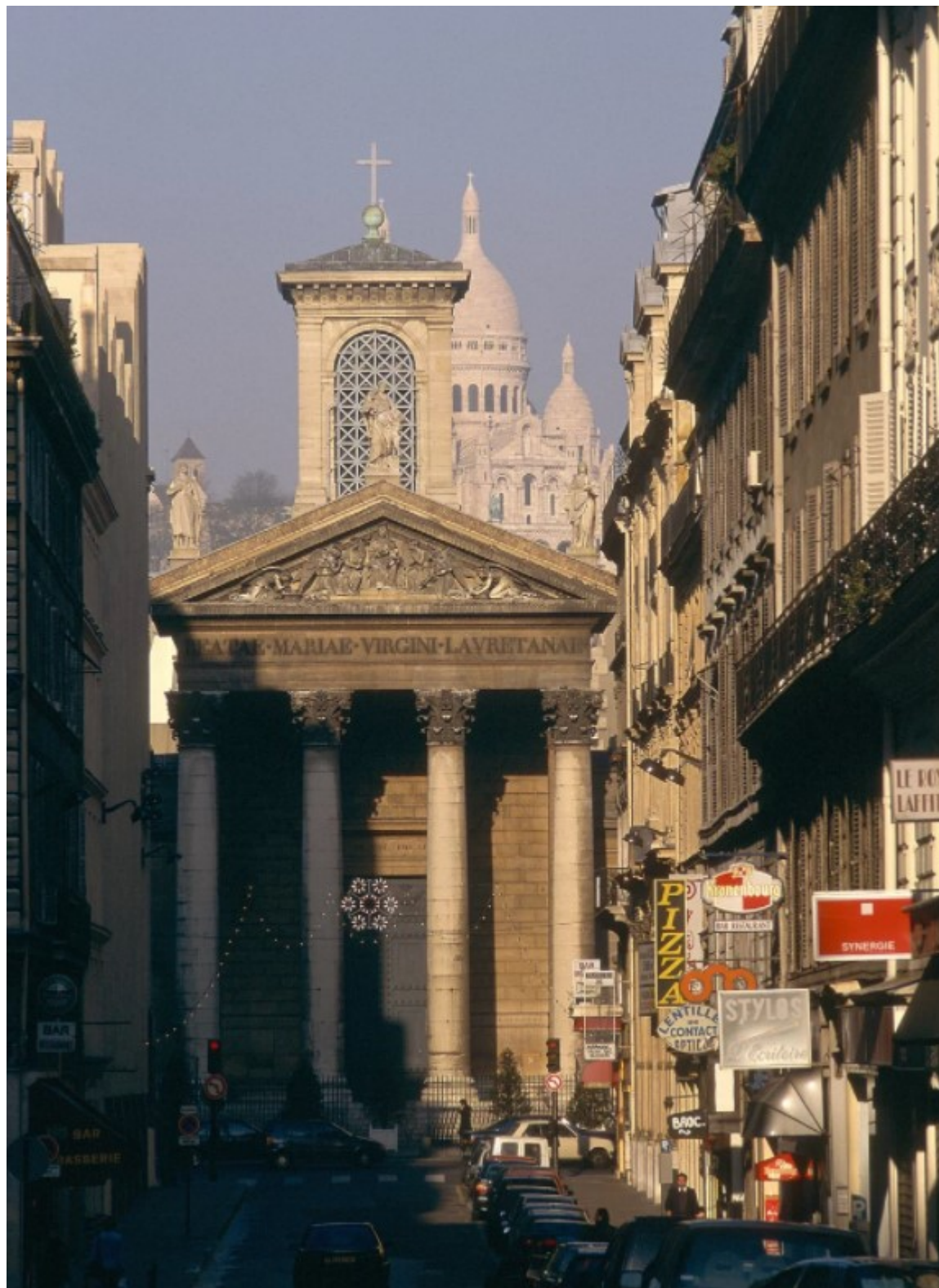
Η εκκλησία Νοτρ Νταμ ντε Λορέτ στη Νέα Αθήνα του Παρισιού

οπότε μετακόμισε στην περιοχή του Σαιν-Ζερμαίν-ντε-Πρε, προκειμένου να βρίσκεται κοντά στην εκκλησία του Αγίου Σουλπικίου, όπου είχε αναλάβει να φιλοτεχνήσει τις τοιχογραφίες στο Παρεκκλήσιο των Αγγέλων.