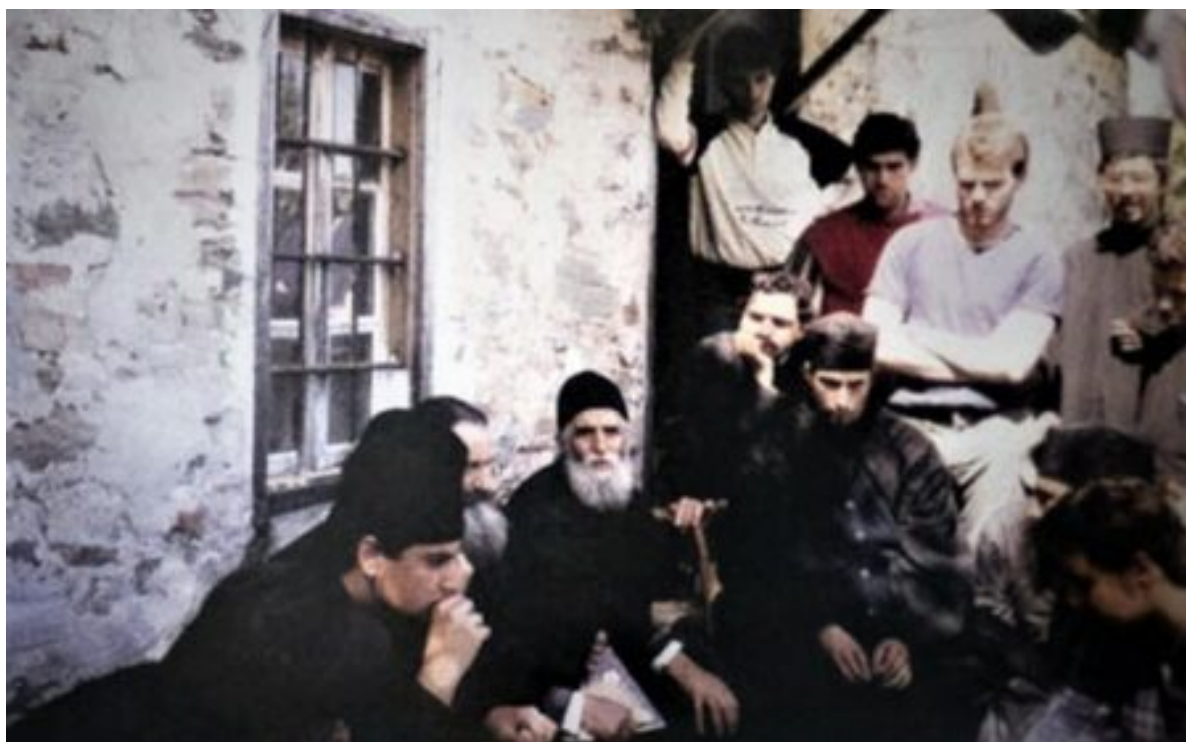
Ο όσιος Παΐσιος (1924-1994) με μαθητές της Αθωνιάδας και προσκυνητές στο κελλί του.