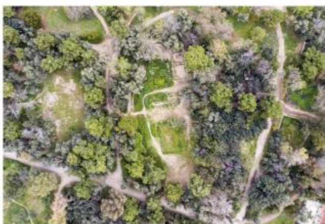
Εικ. 17. Ο τομέας του Γυμνασίου