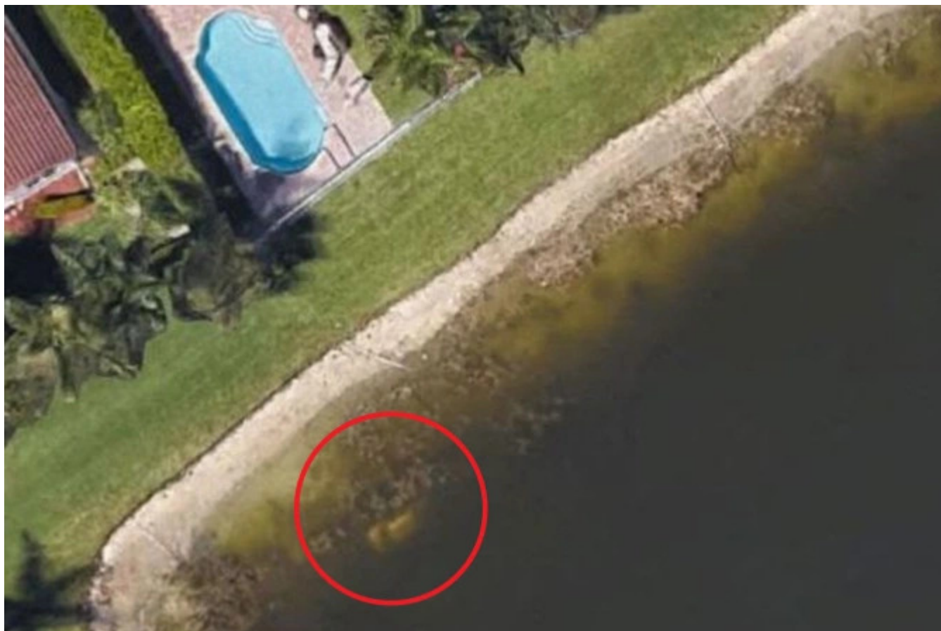
Το αυτοκίνητο διακρίνεται κοντά στην όχθη της λίμνης.

Είναι χαρακτηριστικό το ότι η συγκεκριμένη δορυφορική φωτογραφία της λίμνης που διακρινόταν το αυτοκίνητο ήταν διαθέσιμη στο Google Earth από το 2007.