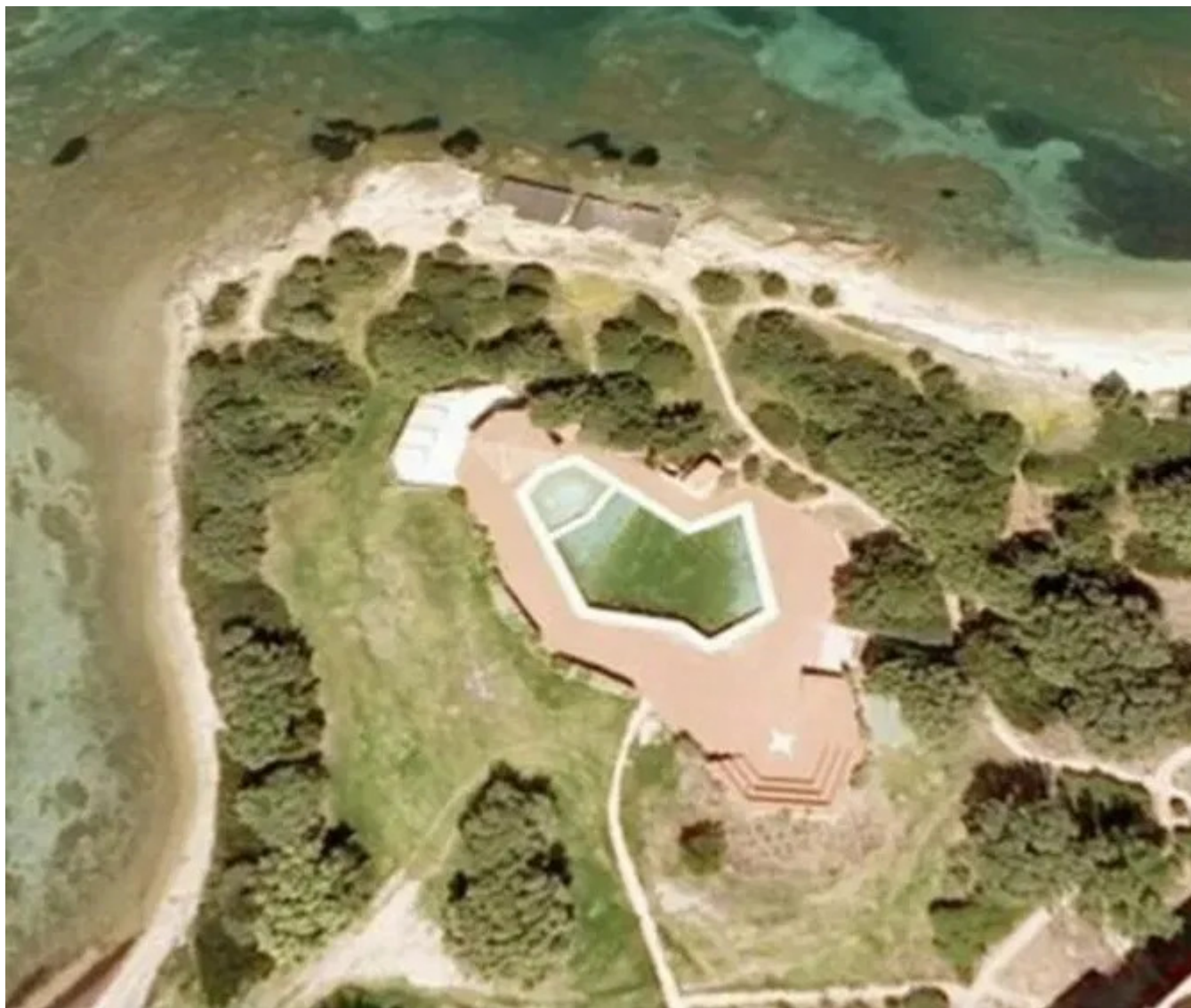
Στη φωτογραφία διακρίνεται η ολυμπιακών διαστάσεων πισίνα της βίλλας.

Αυτά είναι τα καλά της τεχνολογίας. Όσο καλό μπορεί να είναι το αδιαμφισβήτητο γεγονός ότι «μας παρακολουθούν» αρχική εικόνα: Google Maps.