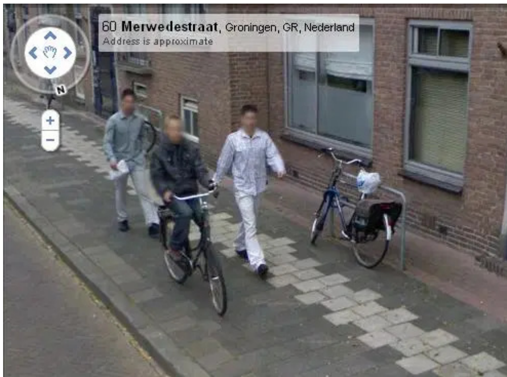
Οι δύο δράστες ακολουθούσαν τον 14χρονο.

Μετά από αίτημα της Αστυνομίας στα κεντρικά του τεχνολογικού κολοσσού, η Google έστειλε την λήψη χωρίς το θόλωμα των προσώπων. Έπειτα το έργο των ολλανδικών αρχών ήταν απλό. Οι δράστες ήταν δύο αδέρφια, τακτικοί «θαμώνες» του τοπικού αστυνομικού τμήματος. Αθηναϊκές αυθαιρεσίες.