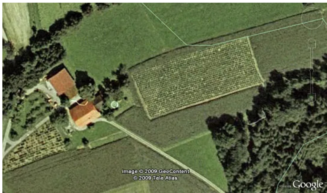
Το «ύποπτο» χωράφι πίσω από μια συνηθισμένη αγροικία.

«Inception» Το 2008, ένας 14χρονος έκανε ποδήλατο στην πόλη Χρόνινγκεν της Ολλανδίας, όταν δύο άντρες τον σταμάτησαν και υπό την απειλή όπλου του απέσπασαν το ποδήλατο, το κινητό και όσα χρήματα είχε πάνω του. Οι αρχές δεν κατάφεραν να βρουν τους δράστες.