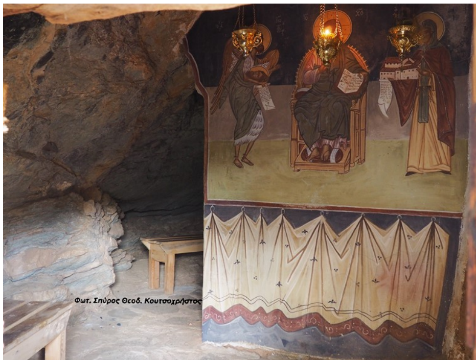
Κείμενο - Φωτογραφίες: Σπύρος Θεοδ. Κουτσοχρήστος