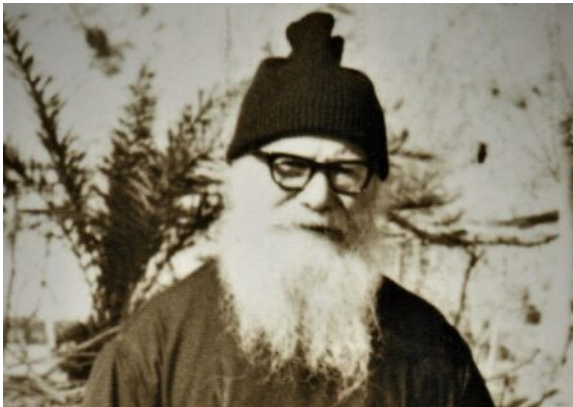
Όσιος Πορφύριος (1906-1991).