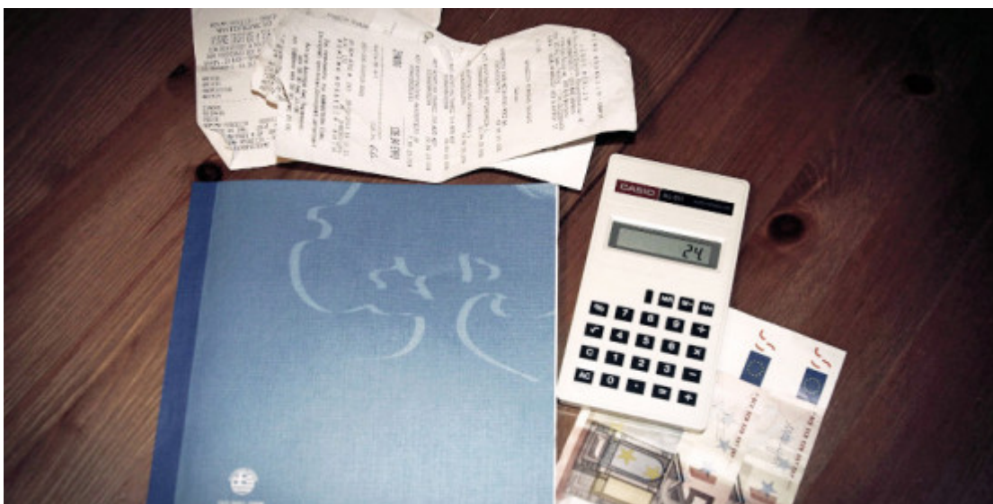
Οι χάρτινες αποδείξεις επιστρέφουν: Με σκανάρισμα θα «μετράνε» στο Taxis

Τρόπους για να κλείσει όσο το δυνατόν περισσότερες «τρύπες» στη φοροδιαφυγή ΦΠΑ αναζητά το υπουργείο Οικονομικών και, όπως φαίνεται, ετοιμάζεται να ξαναβάλει στο «παιχνίδι» τις συναλλαγές με μετρητά, δηλαδή τις χάρτινες αποδείξεις.