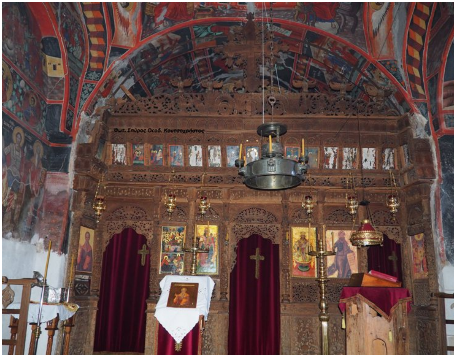
OLYMPUS DIGITAL CAMERA

Όρθρος & Θεία Λειτουργία: 07: 30 - 10 / 02 / 2021