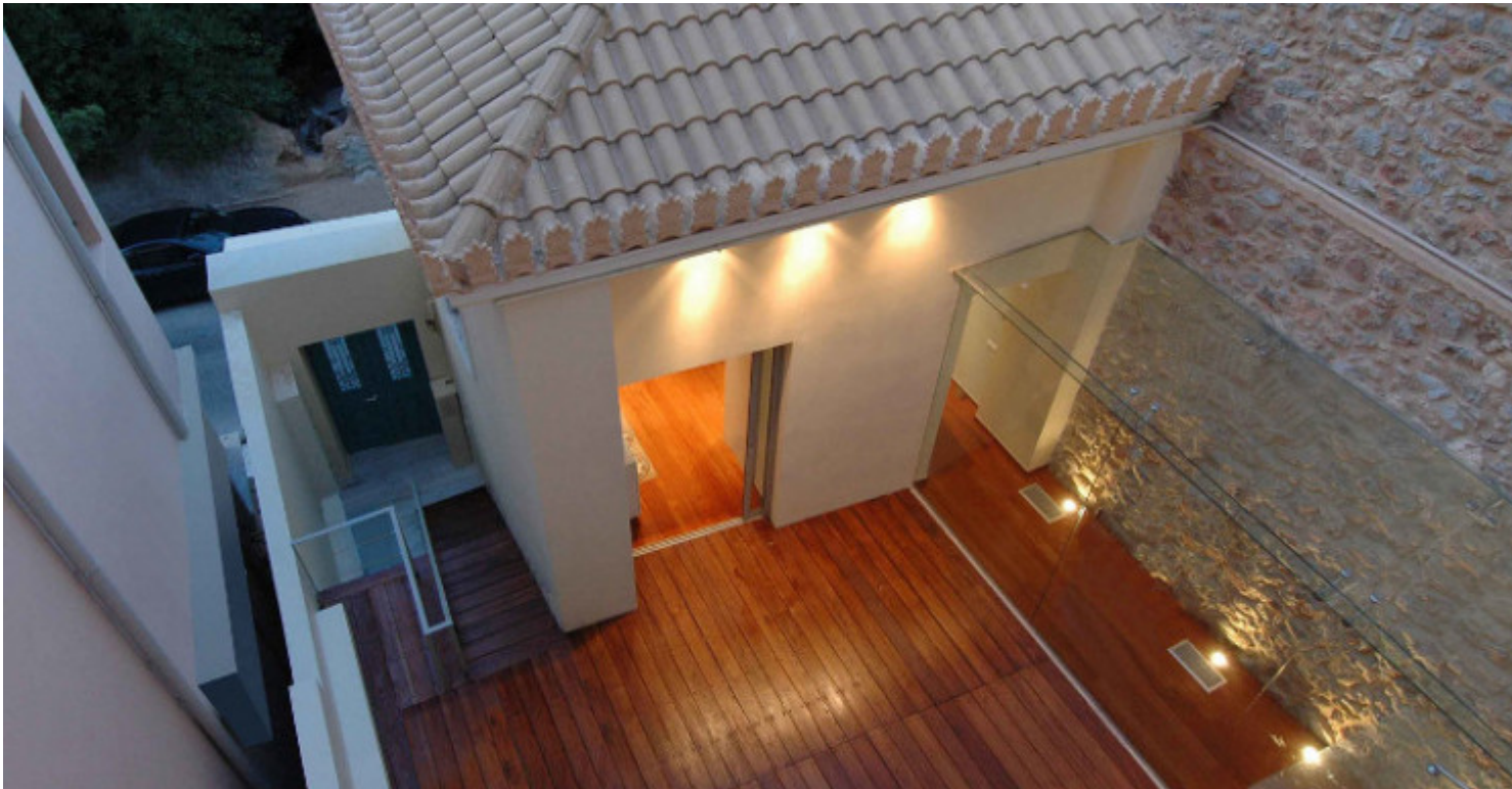
Γενική άποψη του αίθριου και του γυάλινου διαδρόμου που ενώνει το παλαιό με το νέο κτίριο.

Η ανακαίνιση παλιών σπιτιών δεν είναι εύκολη υπόθεση. Πόσο μάλλον όταν μιλάμε για παλιά νεοκλασικά, αυτά τα λιγοστά που έχουν απομείνει στο κέντρο της Αθήνας, τα οποία και τις ανάγκες των ιδιοκτητών πρέπει να καλύπτουν και τα ιδιαίτερα χαρακτηριστικά τους, αυτά που τα καθιστούν «μικρά διαμαντάκια της πόλης» να διατηρήσουν.