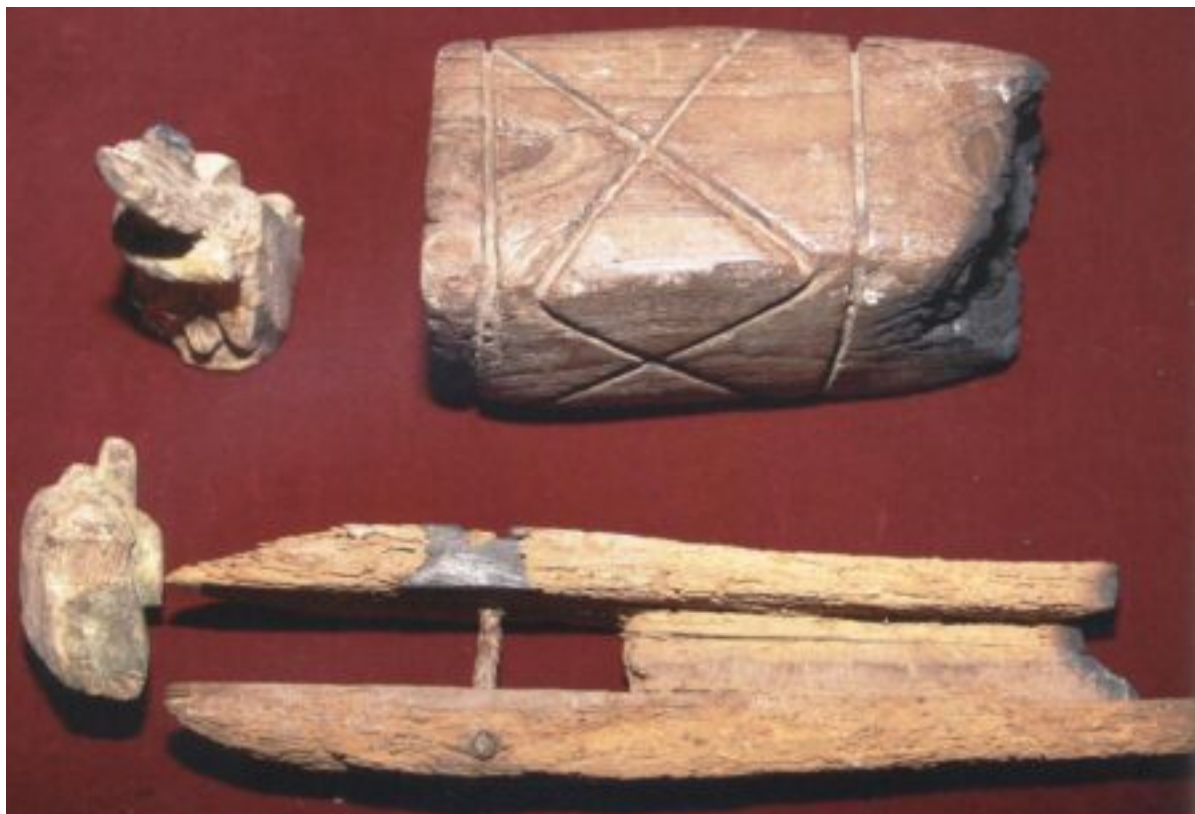
Τα εργαλεία που χρησιμοποιούσε ο άγιος Αναστάσιος ο Θαυματουργός (ο Υφαντής), ο εν Περιστερωνοπηγή.

Εκεί, μόλις τριφτήκαμε τα εργαλεία [εργαλεία που χρησιμοποιούσε ο άγιος ως υφαντής], ο μικρός, που κρατούσε τη γυναίκα μου από το χέρι, της είπε: