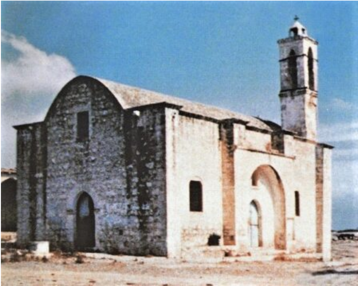
Η παλιά Εκκλησία του Αγίου Αναστασίου του Θαυματουργού την οποία αποκάλεσε «παλιά κλινική».

παλιά (την παλιά εκκλησία του αγίου η οποία βρίσκεται δίπλα στην νέα στο χωριό Περιστερωνοπηγή στην κατεχόμενη σήμερα Κύπρο).