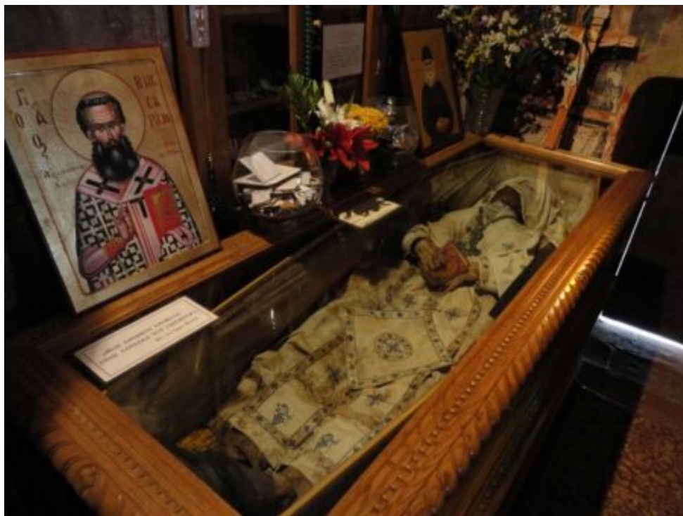
Το άφθαρτο σκήνωμα του Γέροντα Βησσαρίωνα Αγαθωνίτη.

Σε όνειρο που ευλόγησε μια νύχτα να τον δω, φοβήθηκα και τρόμαξα μ' αυτό που θα σας πω.