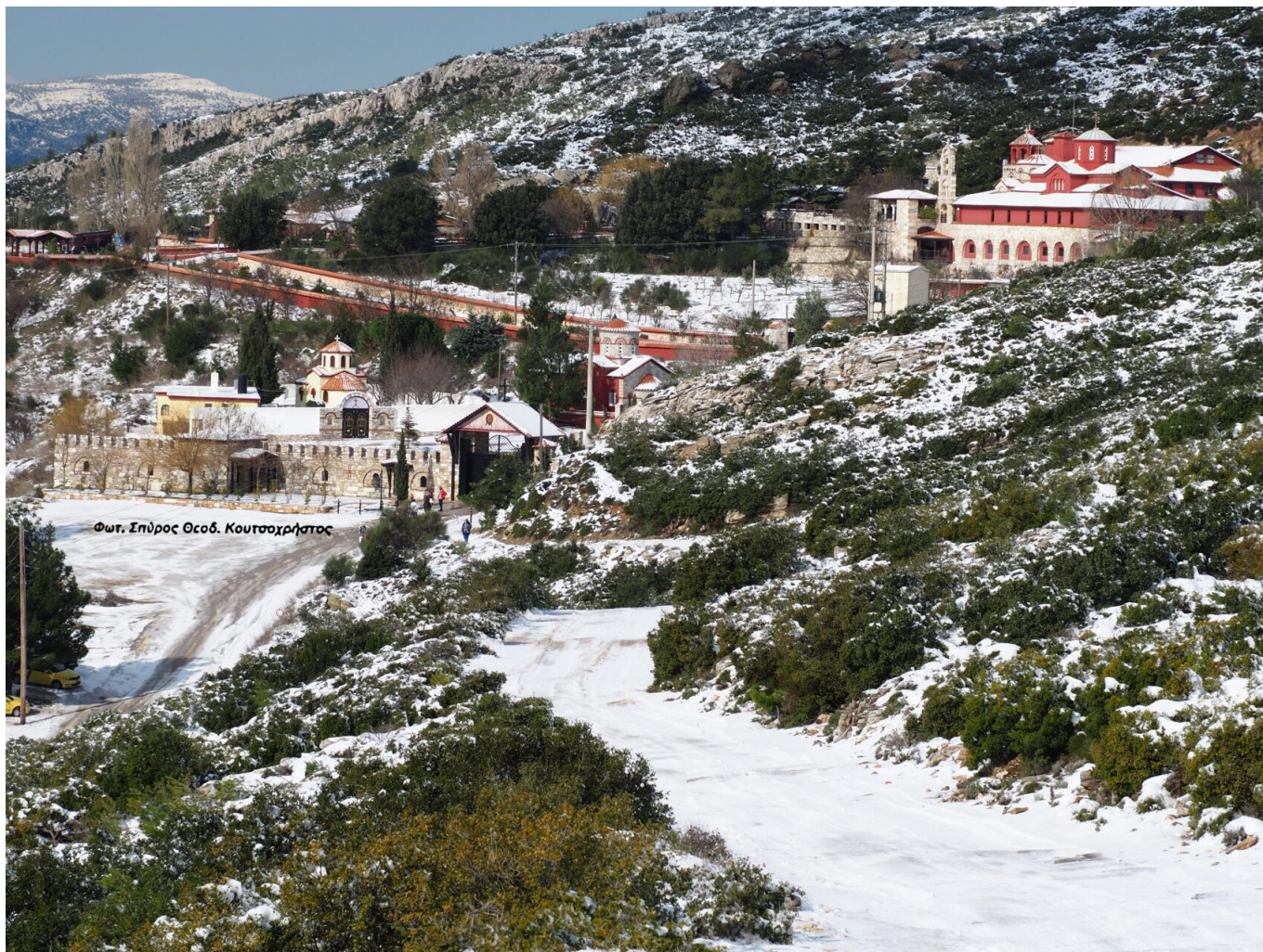
Κείμενο - Φωτογραφίες: Σπύρος Θεοδ. Κουτσοχρήστος