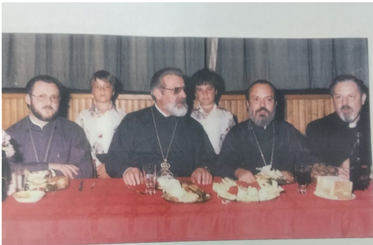
Σε έκδηλωση πρὸς τιμὴν τῆς Πατριαρχικῆς Ἐξαρχίας στὴν Αὐστραλία. Διακρίνονται ὁ Σεβασμιώτατος Μητροπολίτης Φιλαδελφείας κ.κ. Βαρθολομαῖος, νῦν Οἰκουμενικὸς Πατριάρχης καὶ ὁ Μητροπολίτης Σταυρουπόλεως κυρὸς Μάξιμος.

Θερμά σας παρακαλώ αδελφοί μου, μην ξεχνάτε το ταπεινό πρόσωπό μου στις προσευχές σας προς τον Θεό και την κυρία Θεοτόκο, ώστε το υπόλοιπο της ζωής μου στο Ιερό Θυσιαστήριο, να παραμείνω με την χάριν Του Αγίου Θεού, τύπος των πιστών “εν λόγω, εν αναστροφή, εν πίστει, εν αγάπη, εν πνεύματι, εν αγνοία “.