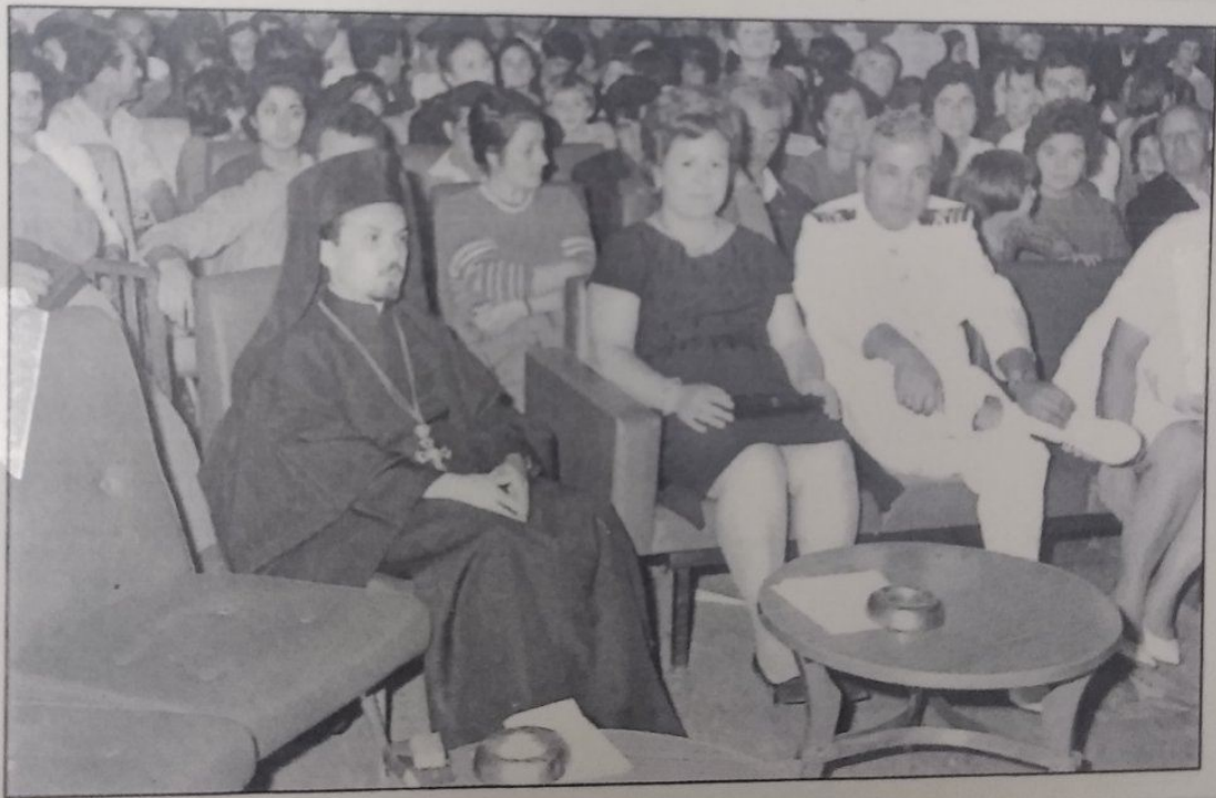
Ὡς συνοδὸς τῶν μεταναστῶν μέσα στὸ πλοῖο "ΠΑΤΡΙΣ" 1964 μὲ κατεύθυνση τὴν Αὐστραλία.

Ευχαριστώ μέσα από την καρδιά μου τον Ἄγιο Θεό που με αξίωσε με την δύναμή