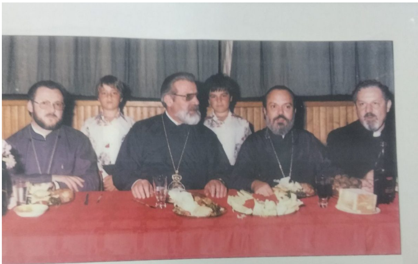
Σε έκδηλωση πρὸς τιμὴν τῆς Πατριαρχικῆς Ἐξαρχίας στὴν Αὐστραλία. Διακρίνονται ὁ Σεβασμιώτατος Μητροπολίτης Φιλαδελφείας κ.κ. Βαρθολομαῖος, νῦν Οἰκουμενικὸς Πατριάρχης καὶ ὁ Μητροπολίτης Σταυρουπόλεως κυρὸς Μάξιμος.

Θερμά σας παρακαλώ αδελφοί μου, μην ξεχνάτε το ταπεινό πρόσωπό μου στις προσευχές σας προς τον Θεό και την κυρία Θεοτόκο, ώστε το υπόλοιπο της ζωής μου στο Ιερό Θυσιαστήριο, να παραμείνω με την χάριν Του Αγίου Θεού, τύπος των πιστών “εν λόγω, εν αναστροφή, εν πίστει, εν αγάπη, εν πνεύματι, εν αγνοία “.