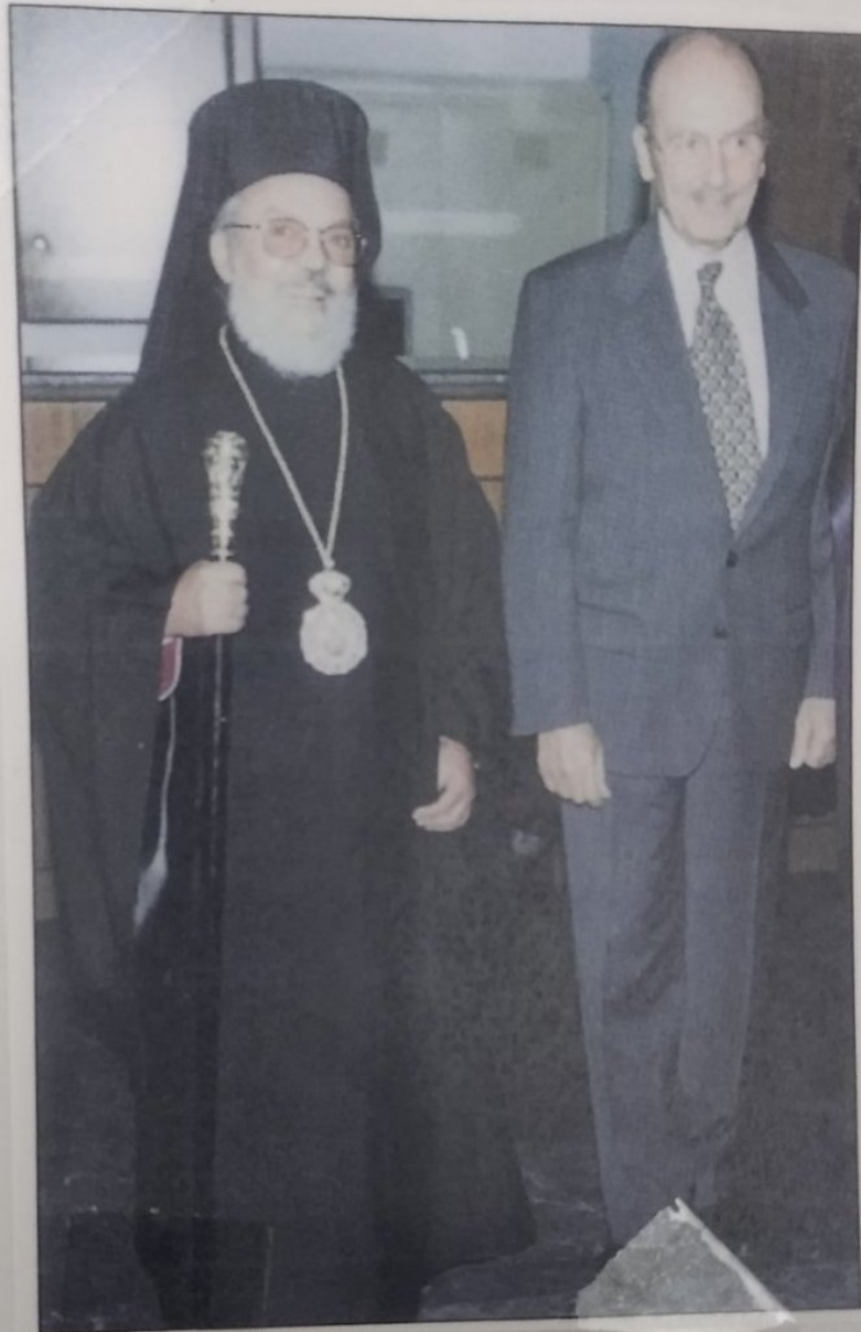
Μὲ τὸν Πρόεδρο τῆς Ἑλληνικῆς Δημοκρατίας κ. Κ. Στεφανόπουλο.

Τα εἴκοσι δύσκολα χρόνια που ἔζησα στην Αυστραλία και τα τριάκοντα κατόπιν