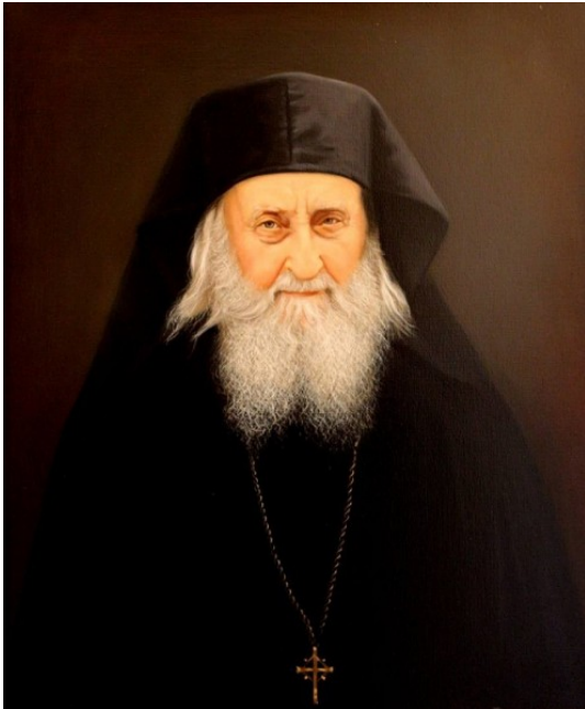
Όσιος Σωφρόνιος Αθωνίτης και του Έσσεξ.

Οι Γερμανοί απεφάσισαν να κάψουν το Μοναστήρι, διότι υποψιάζονταν ότι μέσα κρυβόταν ο Μοσχονάς (ο πατήρ Γεώργιος). Μπερδεύτηκαν όμως και, αντί να πάνε στον Άγιο Παύλο, πήγαν στο Διονυσίου [Ιερά Μονή που βρίσκεται πριν από την Μονή Αγίου Παύλου]. Τους έδωσαν προθεσμία μία εβδομάδα, για να μαζέψουν τα πράγματά τους και να φύγουν.