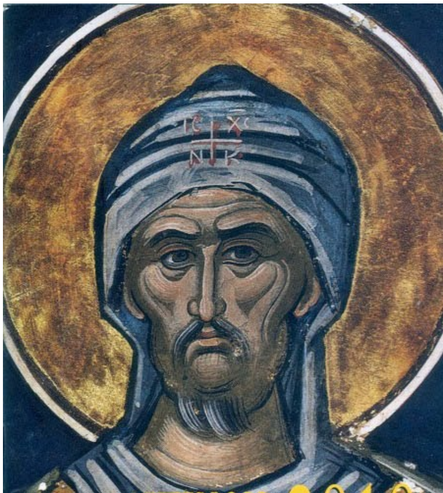
Όσιος Εφραίμ ο Σύρος.

Οι αδελφοί πρέπει να ζουν μεταξύ τους με πολλή αγάπη· είτε προσεύχονται, είτε διαβάζουν τις Γραφές, είτε κάνουν κάτι άλλο, πρέπει να έχουν μεταξύ τους το θεμέλιο της αγάπης· και έτσι μπορεί να πραγματοποιηθεί το θέλημα του Κυρίου σ' εκείνες τις προαιρέσεις.