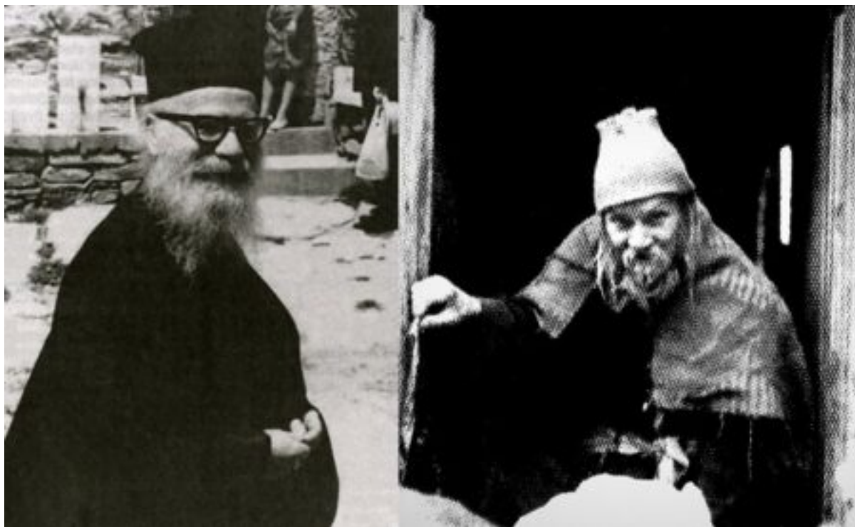
Όσιος Πορφύριος (αριστερά) και ο Γέροντας Ηρωδιώνας.