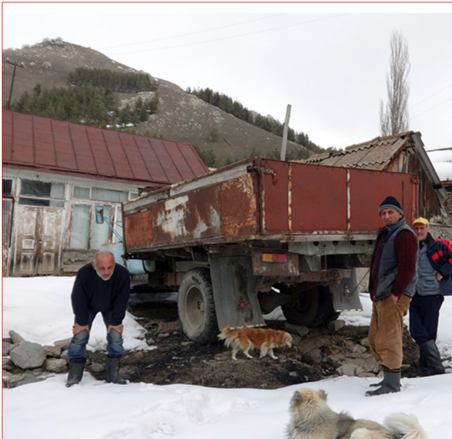
Χωριανοί σε στιγμή ανάπαυλας από τις δύσκολες εργασίες στην κρύα φ

Ναι, το πρώτο ποντιακό χωριό στην Αρμενία, που μάλιστα κράτησε την ποντιακή διάλεκτο.