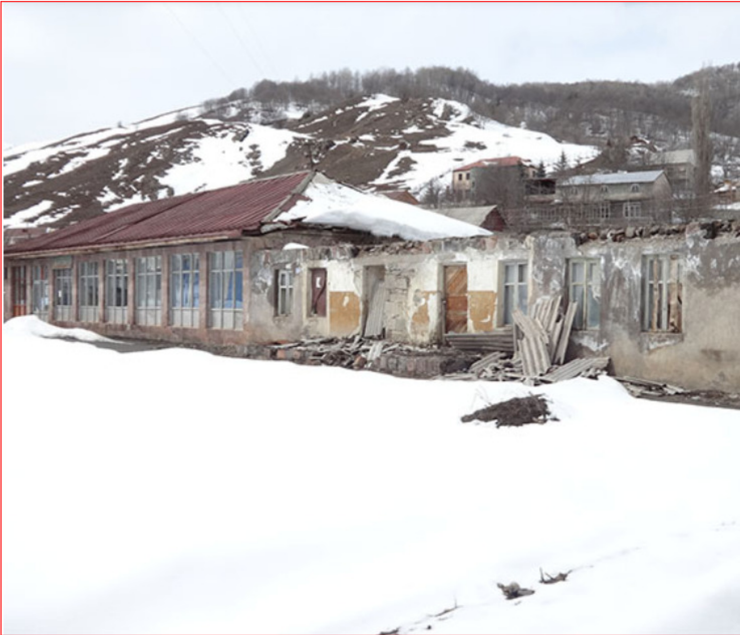
Ο Σταύρος μάς δείχνει τα γκρεμισμένα σπίτια και πλάι τη μοναδική αίθουσα συγκέντρωσης.