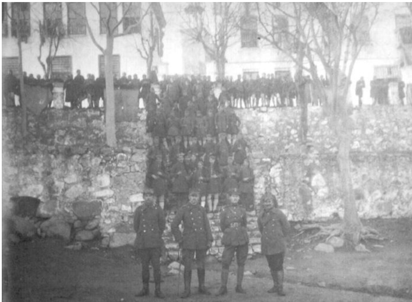
Ο Ελληνικός Στρατός στη Μονή Ταξιαρχών στις 4 Οκτωβρίου 1919, λίγο πριν μπει στην Ξάνθη

Στις 4 Οκτωβρίου 1919, ο ελληνικός στρατός απελευθερώνει για δεύτερη φορά την Ξάνθη, η οποία ενσωματώνεται οριστικά πλέον στον εθνικό κορμό, με ένα μικρό διάλειμμα κατά τη διάρκεια του Β' Παγκοσμίου Πολέμου, οπότε περιήλθε και πάλι στην κατοχή των Βουλγάρων.