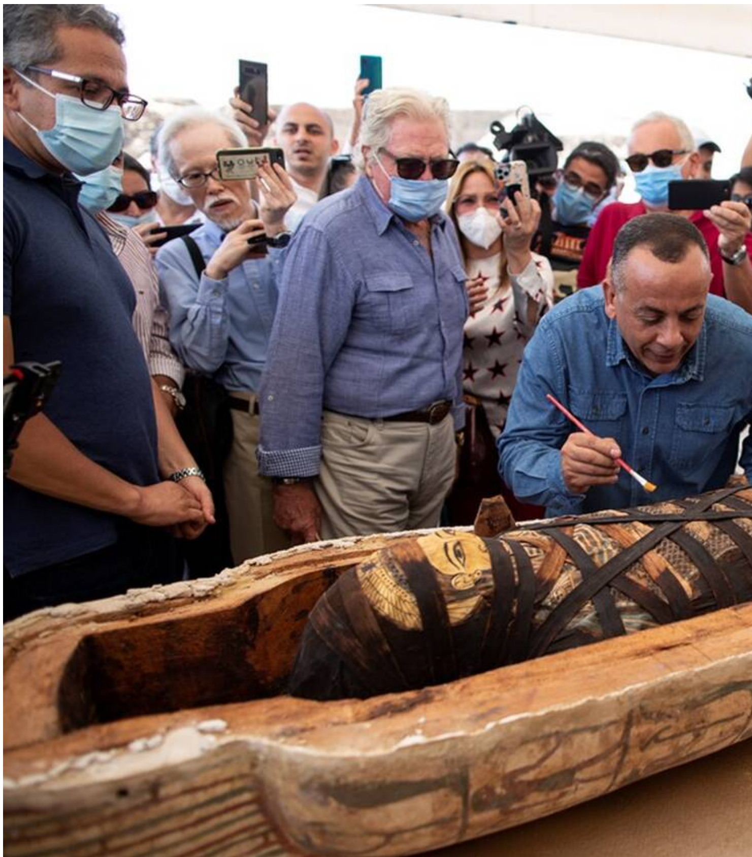
Τη μεγάλη αποκάλυψη έκανε ο Ελ Ανάνι ενώπιον 43 πρέσβων και εκπροσώπων.