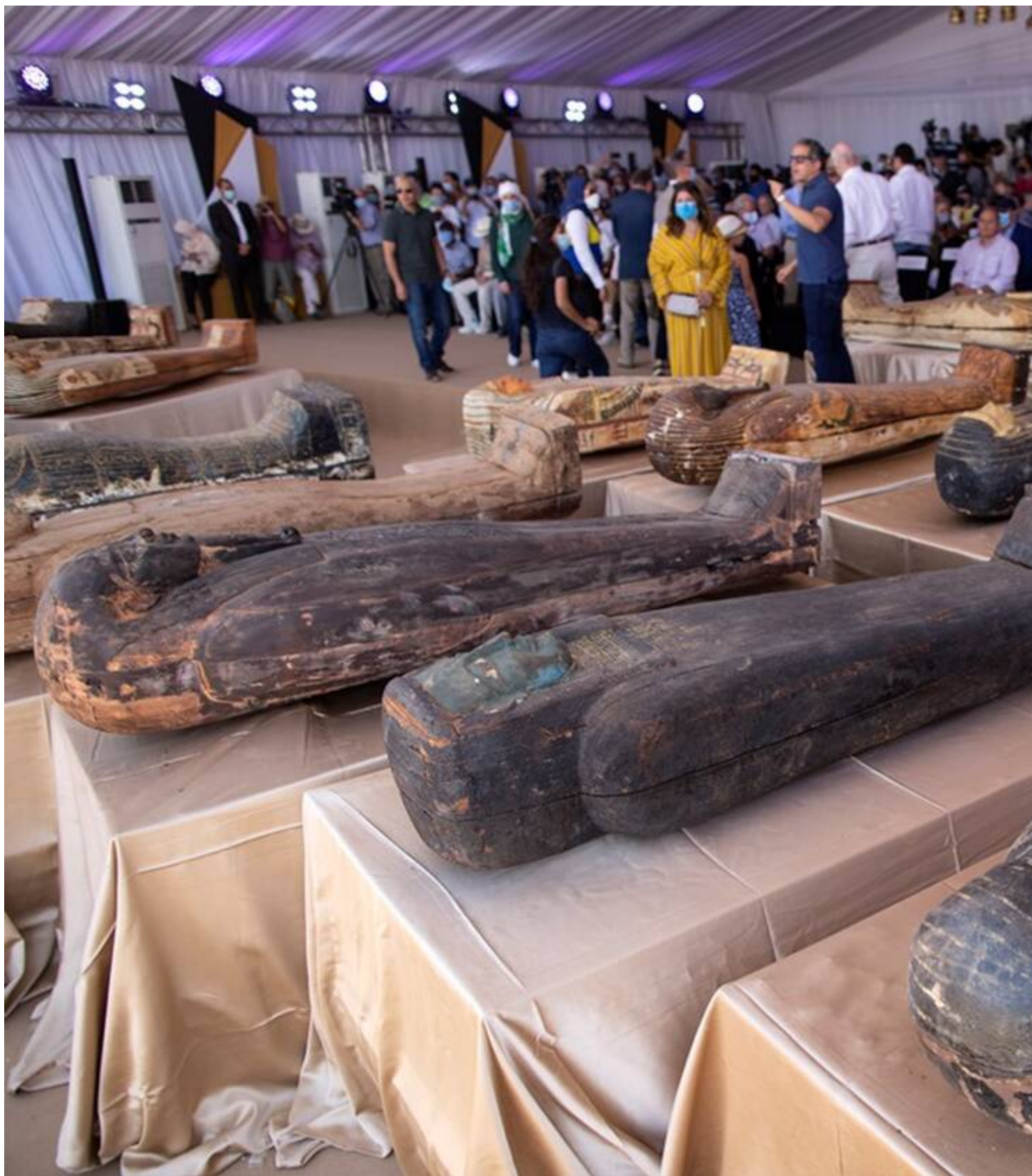
Τη μεγάλη αποκάλυψη έκανε ο Ελ Ανάνι ενώπιον 43 πρέσβων και εκπροσώπων.