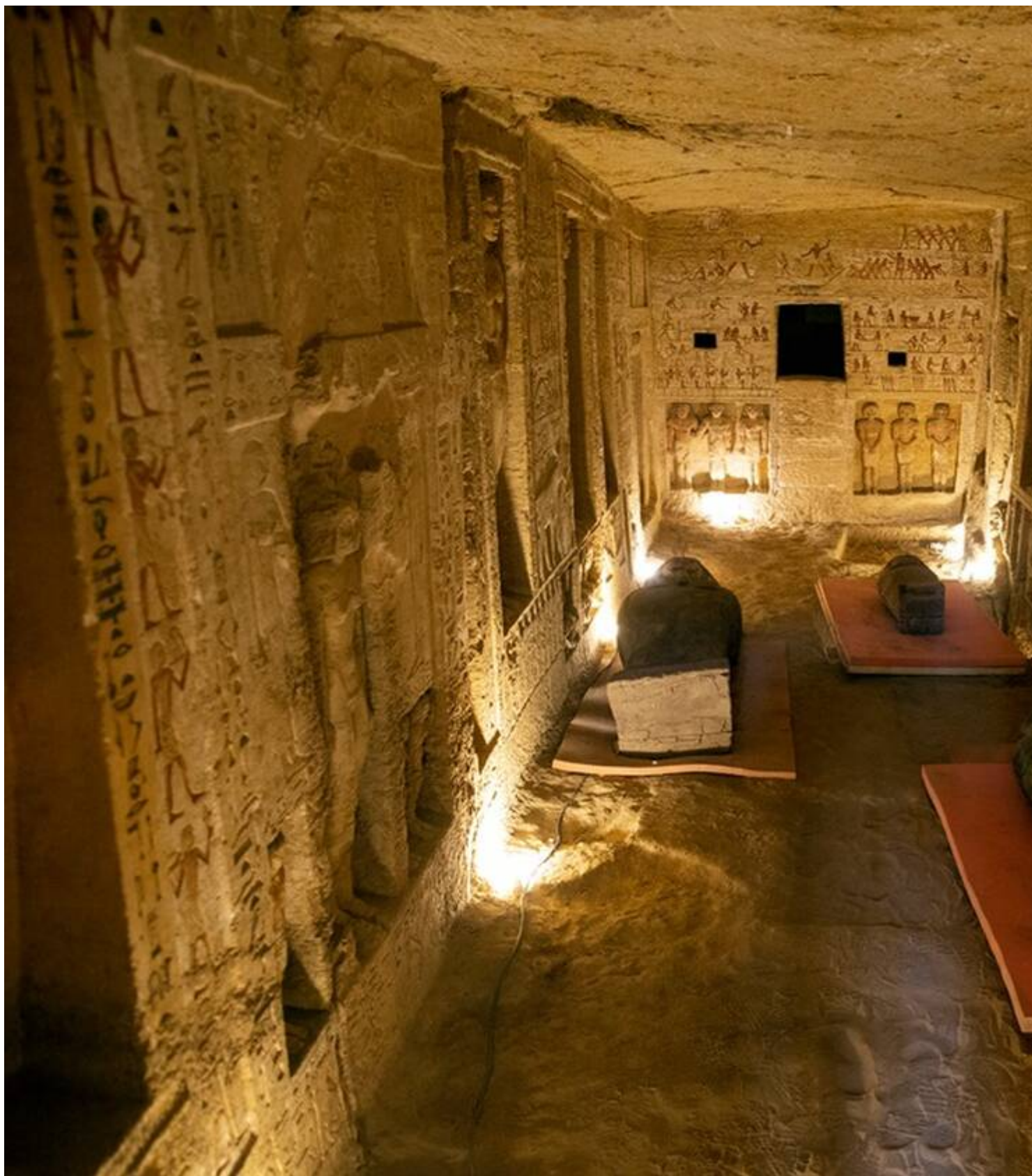
Ο Αιγύπιος υπουργός Αρχαιοτήτων και Τουρισμού προσέθεσε μάλιστα ότι η παγκόσμια πανδημία του COVID-19 δ