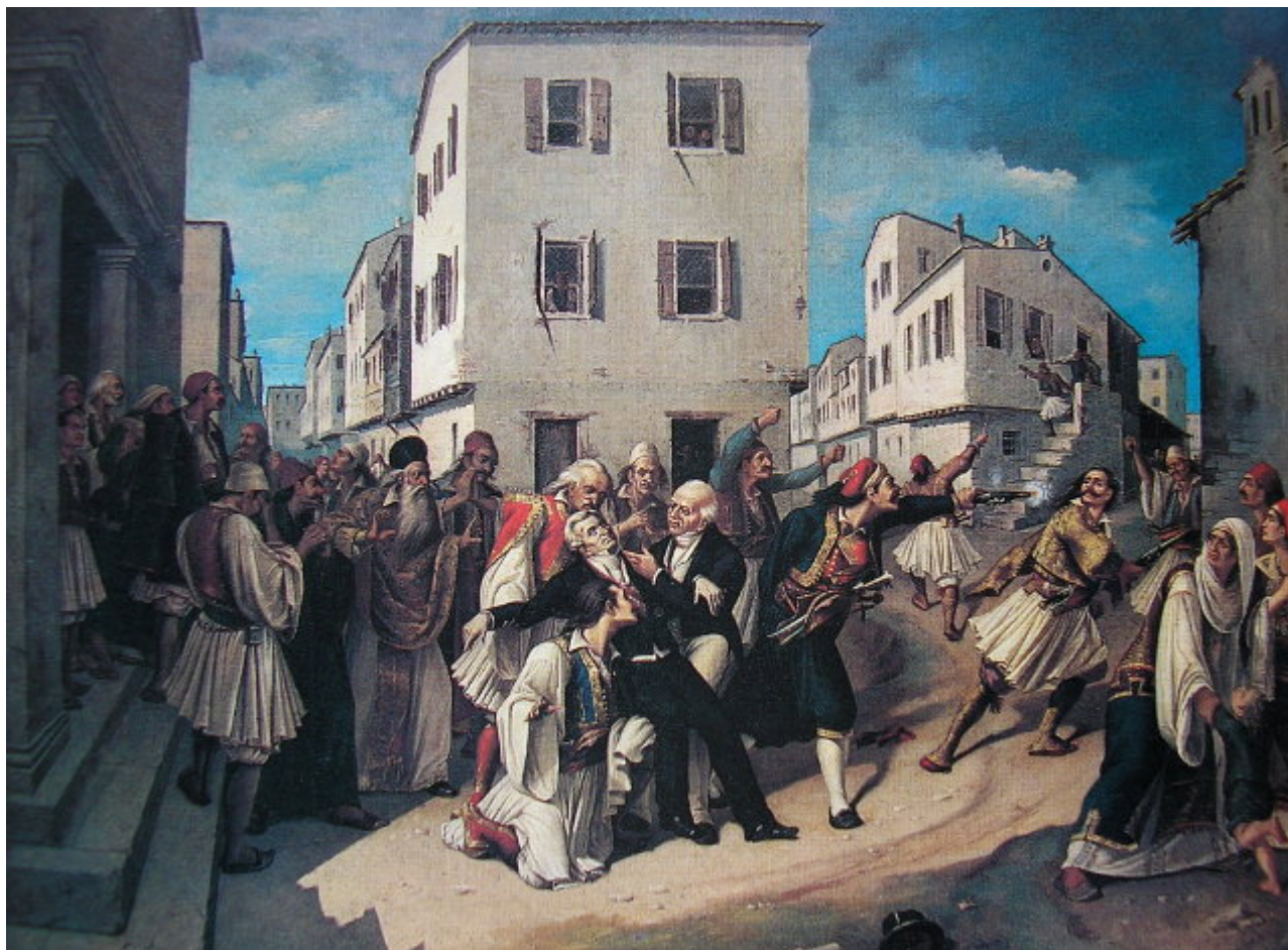
Λιθογραφία του 1827

Ο νέος Κυβερνήτης έθεσε ως στόχο να βάλει τέλος στις εμφύλιες διαμάχες και επιδόθηκε αμέσως στο έργο της δημιουργίας Κράτους εκ του μηδενός, επιδεικνύοντας αξιοζήλευτη δραστηριότητα. Ίδρυσε την Εθνική Χρηματιστική Τράπεζα με τη βοήθεια του φίλου του ελβετού τραπεζίτη Εϋνάρδου, η οποία δεν ευδοκίμησε για πολύ. Ρύθμισε το νομισματικό σύστημα, καθότι ακόμη κυκλοφορούσαν τουρκικά και ξένα νομίσματα εντός της επικράτειας. Στις 28 Ιουλίου 1828 καθιέρωσε ως εθνική νομισματική μονάδα τον Φοίνικα και ίδρυσε Εθνικό Νομισματοκοπείο. Στις 24 Σεπτεμβρίου του ίδιου χρόνου οργάνωσε και την πρώτη ταχυδρομική υπηρεσία.