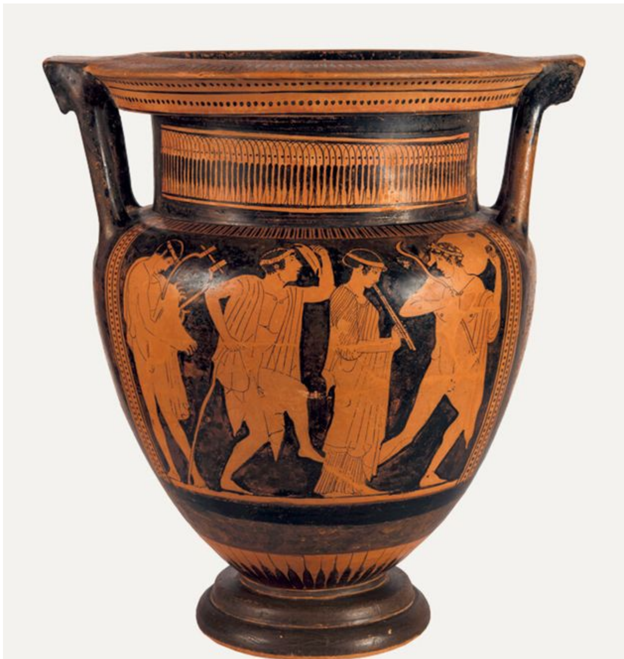
ΜΟΥΣΕΙΟ ΚΥΚΛΑΔΙΚΗΣ ΤΕΧΝΗΣ Ερυθρόμορφος κιονωτός κρατήρας, 470π.Χ

«Highlights των Μονίμων Συλλογών» Πέμπτη 13.00 (αγγλικά).