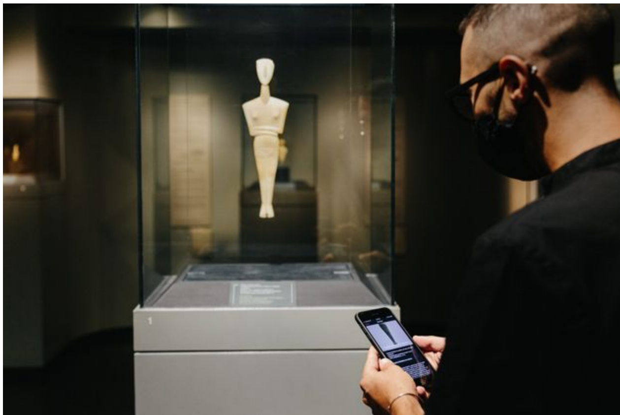
Μουσείο Κυκλαδικής Τέχνης

Η Κέρος είναι σήμερα ένα άγονο, ακατοίκητο νησί ανάμεσα στην Αμοργό και τα Κουφονήσια, στις Νοτιοανατολικές Κυκλάδες. Κατά τη διάρκεια της 3ης χιλιετίας όμως, αποτελούσε το σπουδαιότερο ίσως κέντρο του Αιγαίου πελάγους, μέσα σε ένα τεράστιο δίκτυο επικοινωνίας και πολλαπλών δραστηριοτήτων.