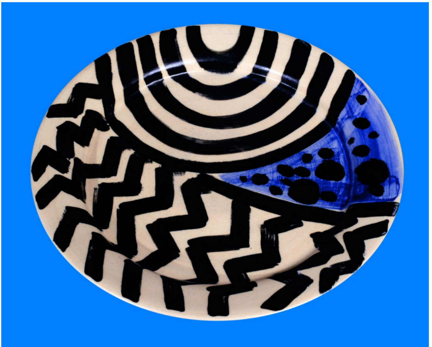
Earthenware με λευκό υάλωμα, επιζωγραφισμένο με πυρροχρώματα, διάμετρος 33

• Φυσικά, επειδή δούλευα πολύ με τον Γιάννη Μόραλη, είμαι πιο πολύ ταυτισμένη με αυτόν. Είχαμε καλή σχέση. Ήταν τελειομανής ο Μόραλης. Για τις μεγάλες κεραμικές επιφάνειες που φτιάχναμε μαζί, την ανάπτυξη του σχεδίου την κάναμε εδώ, με τον Θεμιστοκλή μου. Ο Μόραλης κοίταζε καλά-καλά αυτό που φτιάχναμε κι αν το έβρισκε καλό, καθόταν κοντά μας και άρχιζε να ζωγραφίζει, δηλαδή να κάνει γεμίσματα σε αυτό που εμείς είχαμε φτιάξει. Του άρεσαν πάρα πολύ οι μεγάλες λεκάνες μου, με τα χρώματα, που τα απλώνουμε με τις μπαντανόβουρτσες –τις μεγάλες αυτές βούρτσες που όλοι χρησιμοποιούμε στην κεραμική–, ενώ εκείνος είχε συνηθίσει στα συμβατικά πινέλα. Του άρεσε να παίζει με όλα αυτά τα σύνεργα.