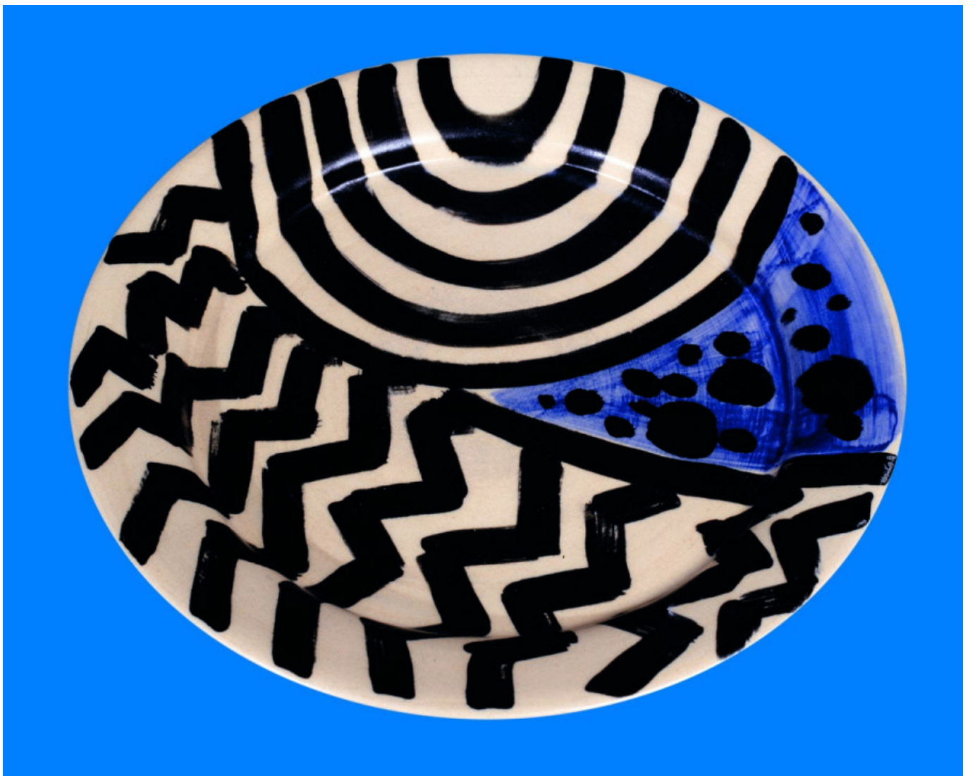
Earthenware με λευκό υάλωμα, επιζωγραφισμένο με πυρροχρώματα, διάμετρος 33