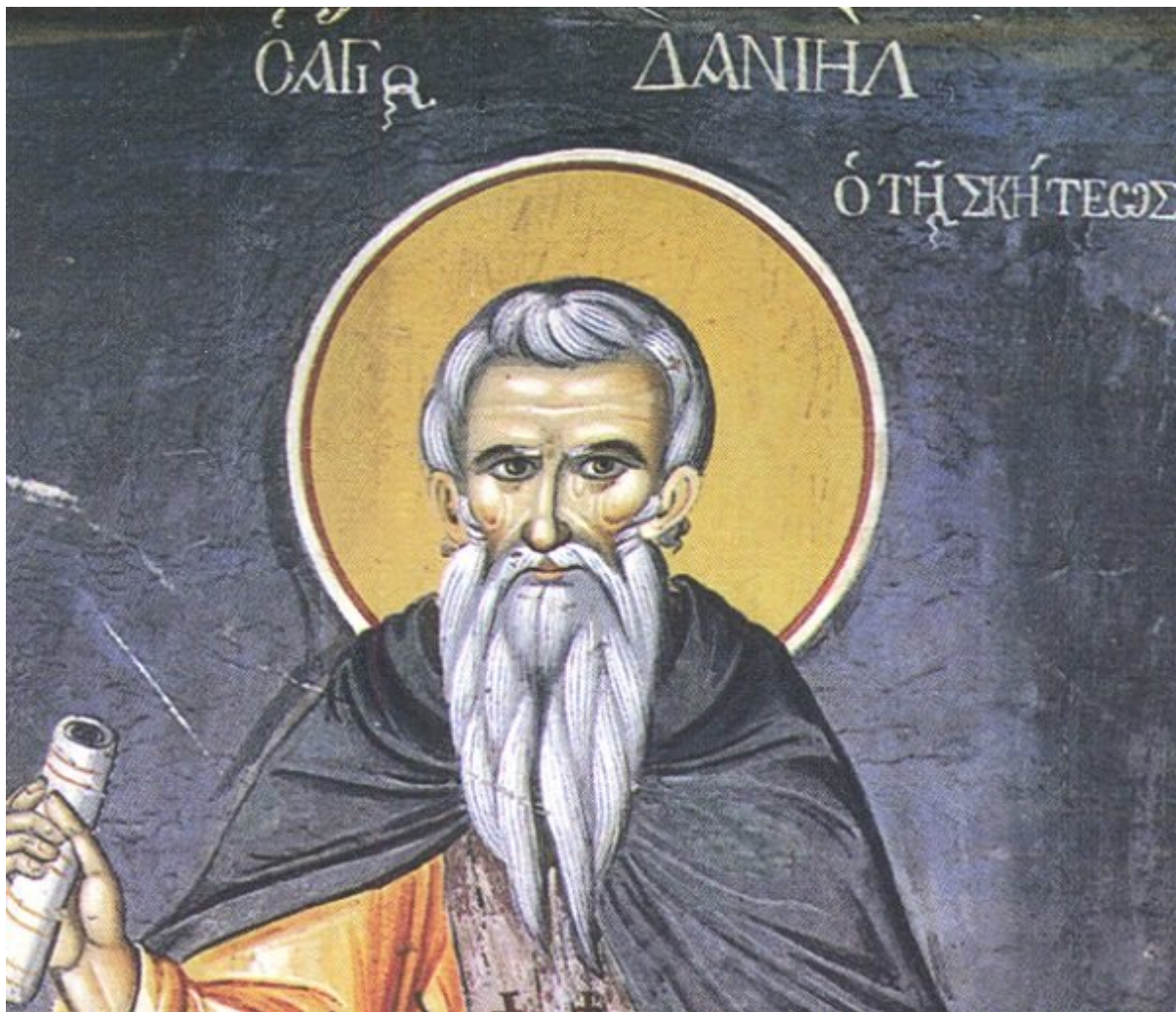
Ο άγιος αββάς Δανιήλ.

Είπε ο αββά Δανιήλ, ότι μας διηγήθηκε ο αββάς Αρσένιος δήθεν για κάποιον άλλον, αλλά στην πραγματικότητα επρόκειτο περί του ιδίου. Ότι, ενώ καθόταν κάποιας γέρος στο κελλί του, άκουσε μια φωνή να του λέη: «Έλα να σου δείξω τι κάνουν οι άνθρωποι».