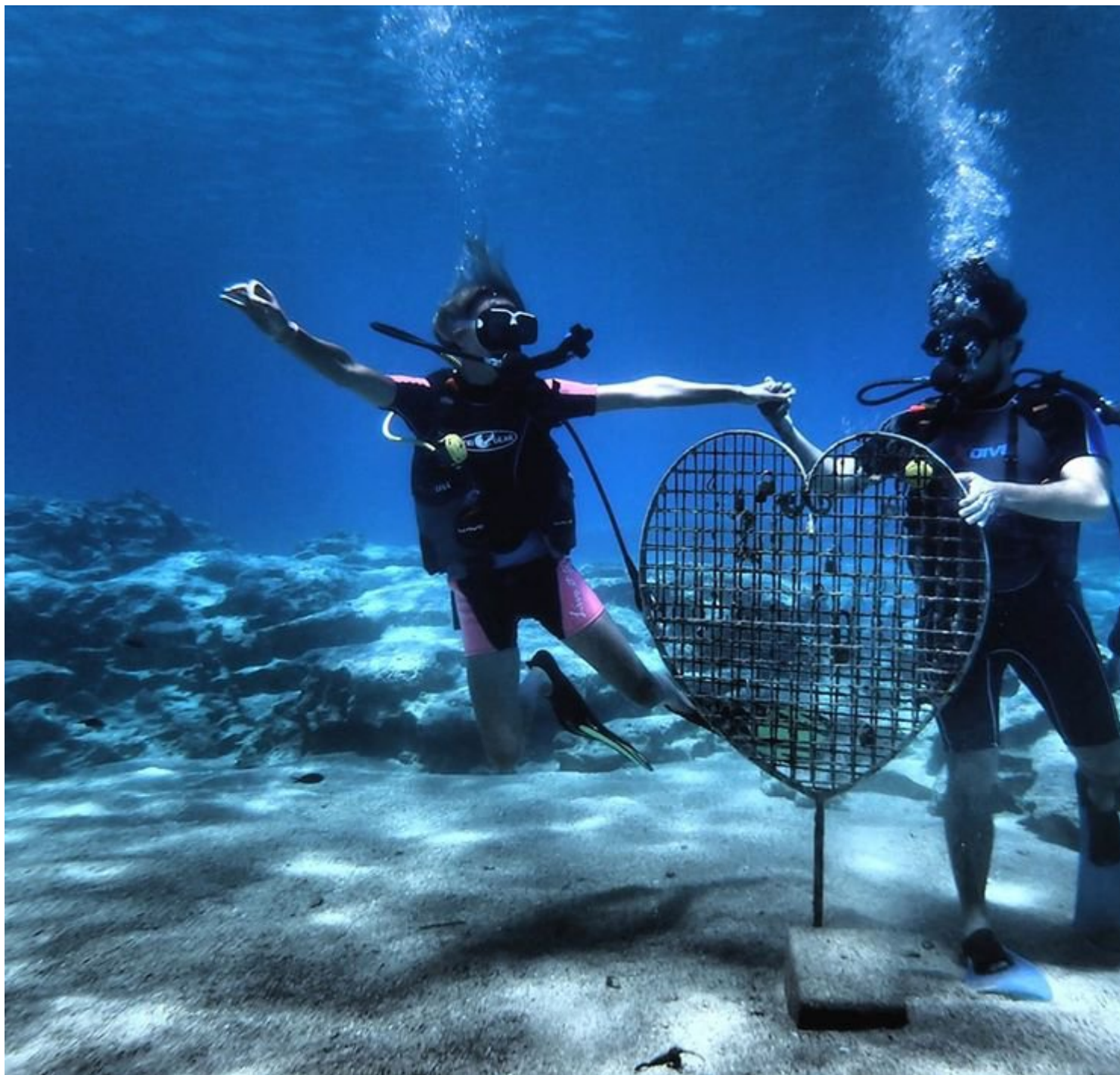
Green Bay, Πρωταράς