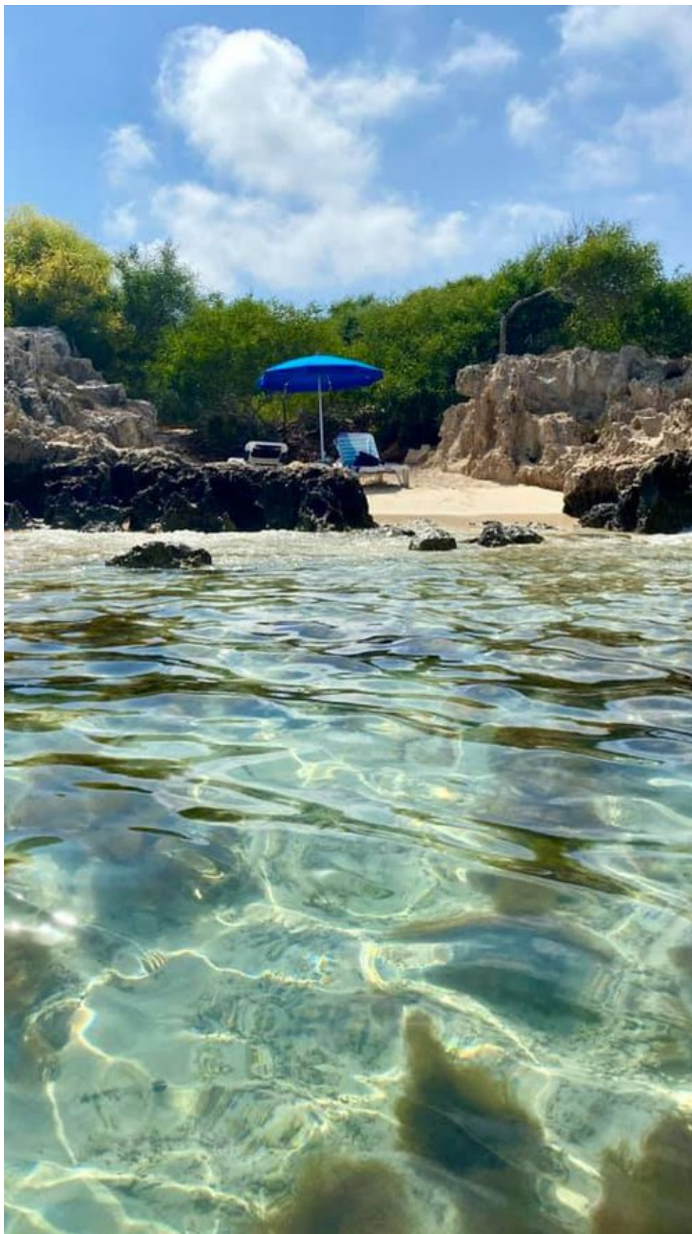
Αγία Νάπα (Μακρόνησος)