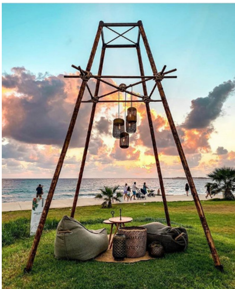
Κάτω Πάφος *