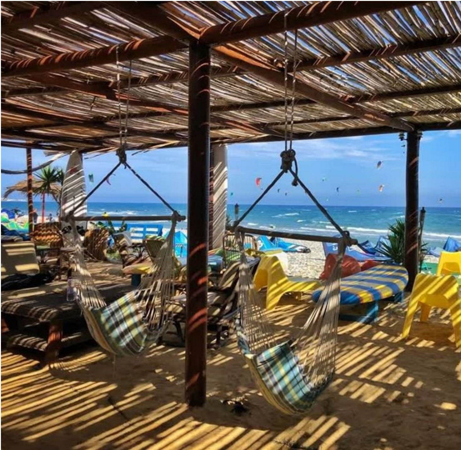
Kite-surfing στον Μαζωτό *