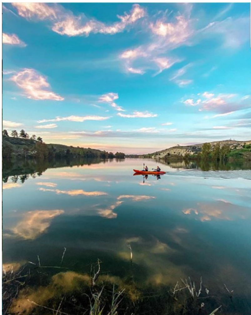
Κανό στο Φράγμα Καπέδων