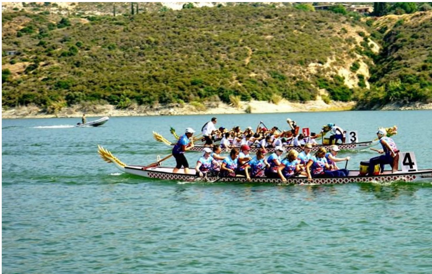
Dragon Boat, Γερασόγεια