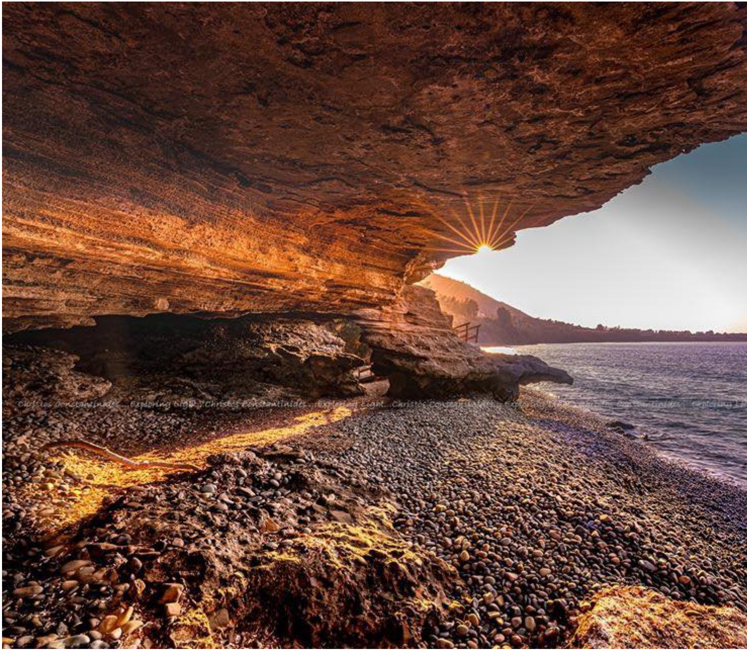
Σπηλιά του Δράκου, Πωμός