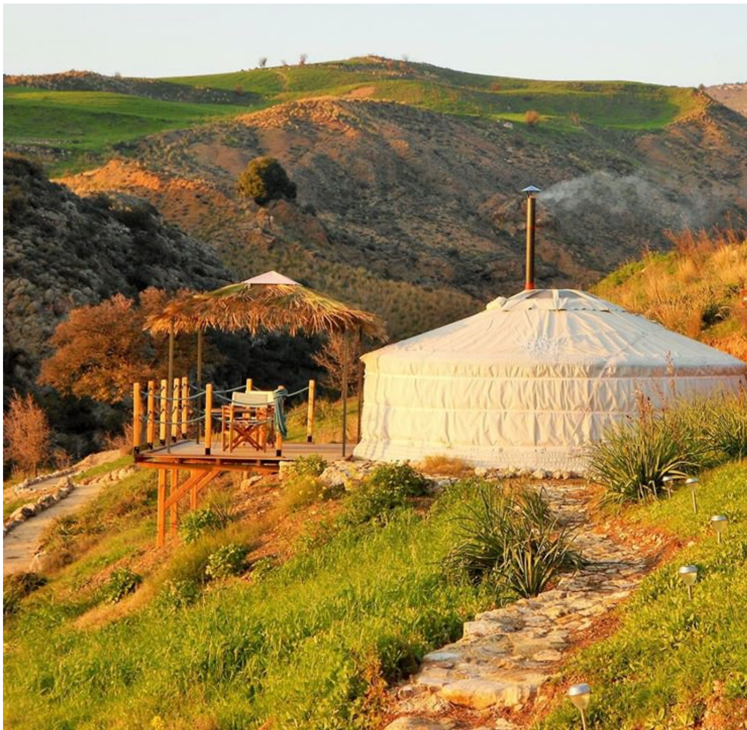
Μογγολικές σκηνές κοντά στα χωριά Σίμου και Ευρέτου, επ. Πάφου *

* Όσα είναι με αστερίσκο αφορούν επιχειρήσεις, εξ ου και δεν αναφέρεται το όνομά τους.