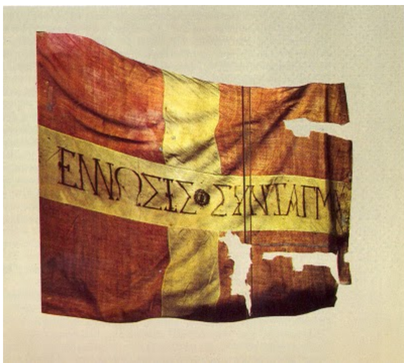
Λάβαρο των επαναστατών της 3ης Σεπτεμβρίου

ενηλικίωσή του στις 20 Μαΐου 1835) προσπάθησαν να δημιουργήσουν μια λειτουργική διοίκηση και έναν οργανωμένο στρατό. Ο απολυταρχικός τρόπος διακυβέρνησής όμως, η επιμονή του να κρατά εκτός κυβέρνησης τους Έλληνες πολιτικούς και η σκανδαλώδη προτίμηση των συμπατριωτών του Βαυαρών στο δημόσιο βίο, επισκίαζαν τις προσπάθειές του και προκαλούσαν έντονες αντιδράσεις από τα τρία κόμματα («αγγλικό», «γαλλικό», «ρωσικό»), κορύφωσή των οποίων αποτέλεσε η Επανάσταση της 3ης Σεπτεμβρίου 1843. Τον Ιανουάριο του ίδιου έτους η ανακοίνωσή της Ελλάδας, προς τις τρεις προστάτιδες δυνάμεις Αγγλία, Γαλλία και Ρωσία ότι αδυνατούσε να αποπληρώσει τα τοκοχρεολύσια του δανείου των 60.000.000 φράγκων για το εξάμηνο που έληγε την 1η Μαρτίου, αντιμετωπίστηκε αρνητικά και επιτιμητικά και από τους ισχυρούς «συμμάχους».