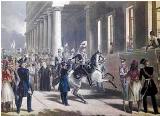
Ο έφιππος Καλλέργης ζητά από τον βασιλιά Όθωνα την παραχώρηση Συντάγματος (αγνώστου ζωγράφου, συλλογή Λάμπρου Ευταξία)

τους». Ο συνταγματάρχης απάντησε «Μεγαλειότατε δεν θα διαλυθούν μέχρις ότου αποφασίσετε με το Συμβούλιο της Επικρατείας». Μπροστά στην επιμονή των επαναστατών και την άρνησή τους να συναντήσουν τους πρεσβευτές των τριών Δυνάμεων ο Όθωνας αναγκάστηκε να υποχωρήσει. Υπέγραψε την άμεση σύγκληση «Εθνικής Συνέλευσης», τον διορισμό νέου υπουργικού συμβουλίου και την απομάκρυνση όλων των ξένων που υπηρετούσαν σε κρατικές υπηρεσίες. Παράλληλα υπέγραψε διάταγμα, με το οποίο η 3η Σεπτεμβρίου ανακηρυσσόταν «ημέρα εορτάσιμος...» και απονεμόταν η βασιλική ευαρέσκεια στον Καλλέργη και στον Μακρυγιάννη επειδή τήρησαν την τάξη και την ασφάλεια κατά τα γεγονότα της ημέρας!