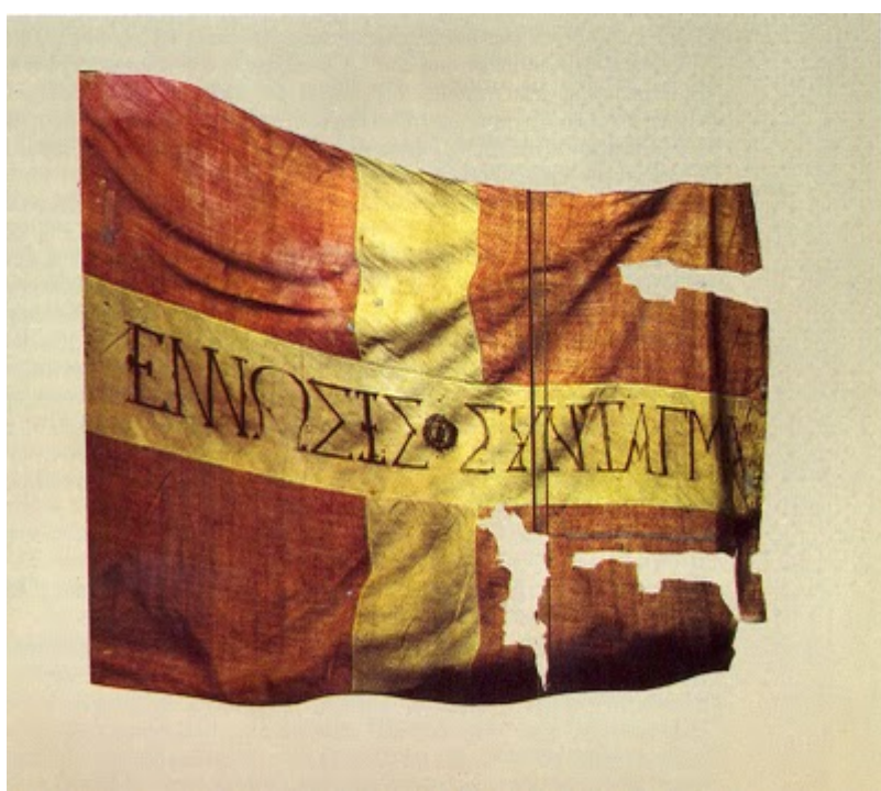
Λάβαρο των επαναστατών της 3ης Σεπτεμβρίου

ενηλικίωσή του στις 20 Μαΐου 1835) προσπάθησαν να δημιουργήσουν μια λειτουργική διοίκηση και έναν οργανωμένο στρατό. Ο απολυταρχικός τρόπος διακυβέρνησής όμως, η επιμονή του να κρατά εκτός κυβέρνησης τους Έλληνες πολιτικούς και η σκανδαλώδη προτίμηση των συμπατριωτών του Βαυαρών στο δημόσιο βίο, επισκίαζαν τις προσπάθειές του και προκαλούσαν έντονες αντιδράσεις από τα τρία κόμματα («αγγλικό», «γαλλικό», «ρωσικό»), κορύφωσή των οποίων αποτέλεσε η Επανάσταση της 3ης Σεπτεμβρίου 1843. Τον Ιανουάριο του ίδιου έτους η ανακοίνωσή της Ελλάδας, προς τις τρεις προστάτιδες δυνάμεις Αγγλία, Γαλλία και Ρωσία ότι αδυνατούσε να αποπληρώσει τα τοκοχρεολύσια του δανείου των 60.000.000 φράγκων για το εξάμηνο που έληγε την 1η Μαρτίου, αντιμετωπίστηκε αρνητικά και επιτιμητικά και από τους ισχυρούς «συμμάχους».