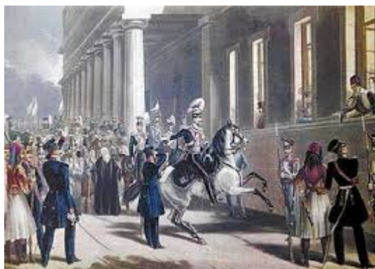
Ο έφιππος Καλλέργης ζητά από τον βασιλιά Όθωνα την παραχώρηση Συντάγματος (αγνώστου ζωγράφου, συλλογή Λάμπρου Ευταξία)

τους». Ο συνταγματάρχης απάντησε «Μεγαλειότατε δεν θα διαλυθούν μέχρις ότου αποφασίσετε με το Συμβούλιο της Επικρατείας». Μπροστά στην επιμονή των επαναστατών και την άρνησή τους να συναντήσουν τους πρεσβευτές των τριών Δυνάμεων ο Όθωνας αναγκάστηκε να υποχωρήσει. Υπέγραψε την άμεση σύγκληση «Εθνικής Συνέλευσης», τον διορισμό νέου υπουργικού συμβουλίου και την απομάκρυνση όλων των ξένων που υπηρετούσαν σε κρατικές υπηρεσίες. Παράλληλα υπέγραψε διάταγμα, με το οποίο η 3η Σεπτεμβρίου ανακηρύσσεται «ημέρα εορτάσιμος...» και απονεμόταν η βασιλική ευαρέσκεια στον Καλλέργη και στον Μακρυγιάννη επειδή τήρησαν την τάξη και την ασφάλεια κατά τα γεγονότα της ημέρας!