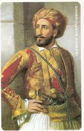
Ο Ιωάννης Μακρυγιάννης. Ο αγωνιστής του 1821 συμμετείχε στην Επανάσταση της 3ης Σεπτεμβρίου

συνταγματάρχης Σκαρβέλης, διοικητής του πεζικού. Αρχικά ως ημερομηνία της εξέγερσης ορίστηκε η 25η Μαρτίου 1844. Επειδή όμως οι φήμες για την συνωμοσία είχαν αρχίσει ήδη να κυκλοφορούν, οι ηγέτες αποφάσισαν να προχωρήσουν την 1η Σεπτεμβρίου 1843.