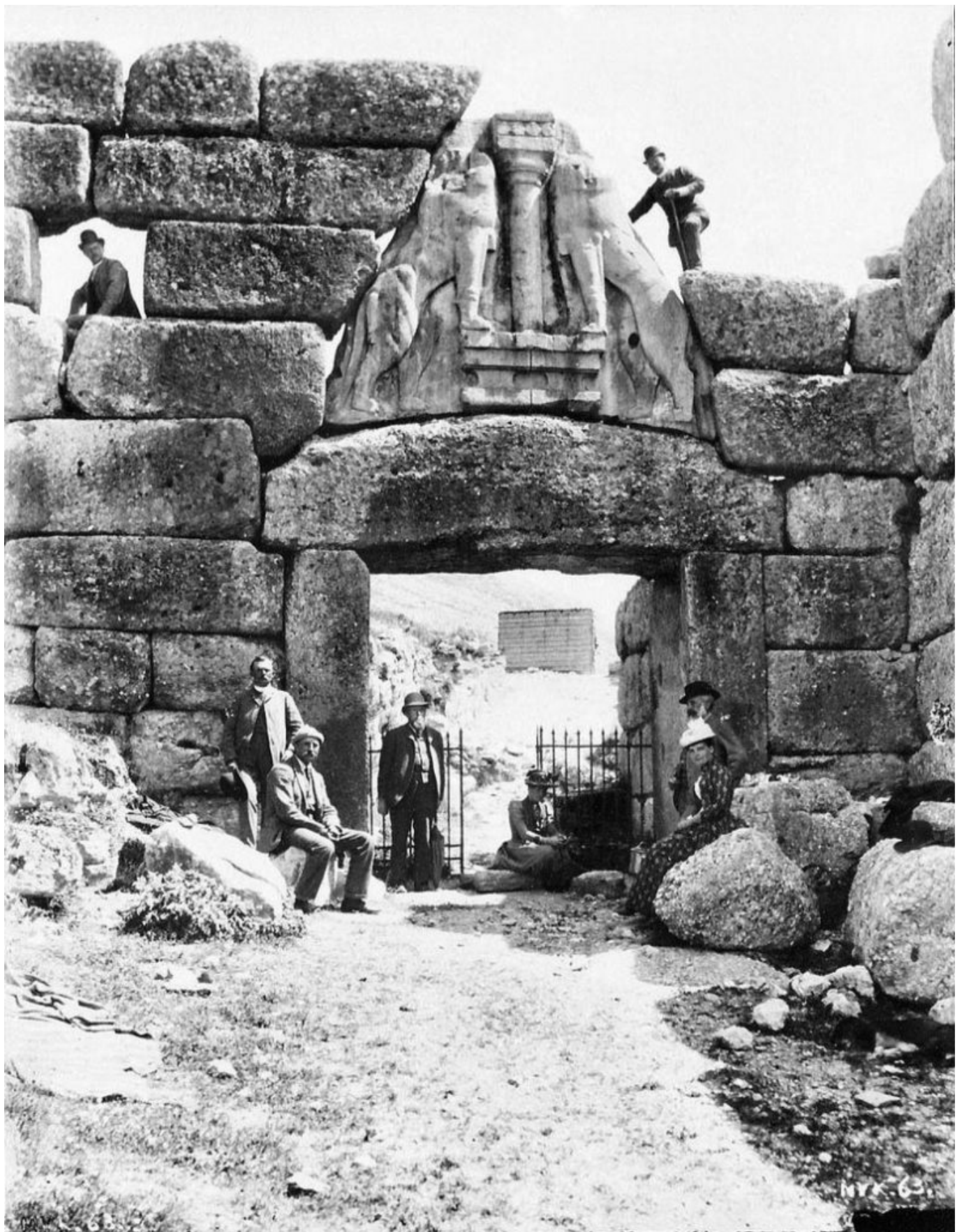
Το 1950 έγιναν μάλιστα και κάποιες αναστηλωτικές εργασίες.