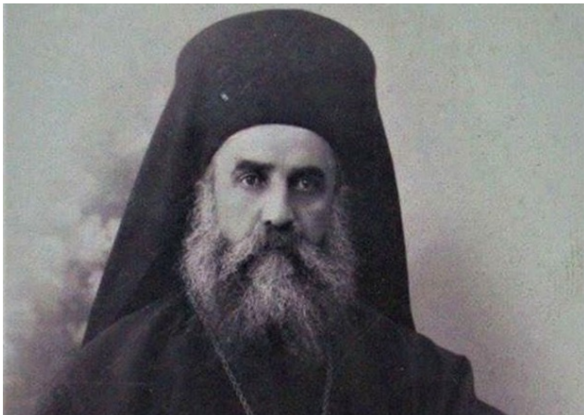
Άγιος Νεκτάριος Επίσκοπος Πενταπόλεως (1846-1920).

Τίποτα δεν είναι μεγαλύτερο από την καθαρή καρδιά, γιατί μια τέτοια καρδιά γίνεται θρόνος του Θεού.