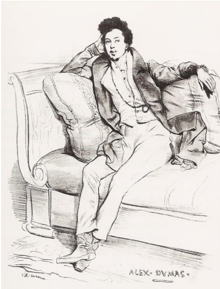
Alexandre Dumas by Achille Devéria (1829)

Είναι παντοδύναμος και παντογνώστης - όχι μόνο από τη μόρφωση που πήρε από τον αβιά Φαρία μέσα στη φυλακή, αλλά και διαβάζοντας συνεχώς στις απέραντες βιβλιοθήκες του. Ξέρει όλες τις γνωστές γλώσσες (ακόμα και αρχαία και νέα ελληνικά, καθώς και λατινικά),