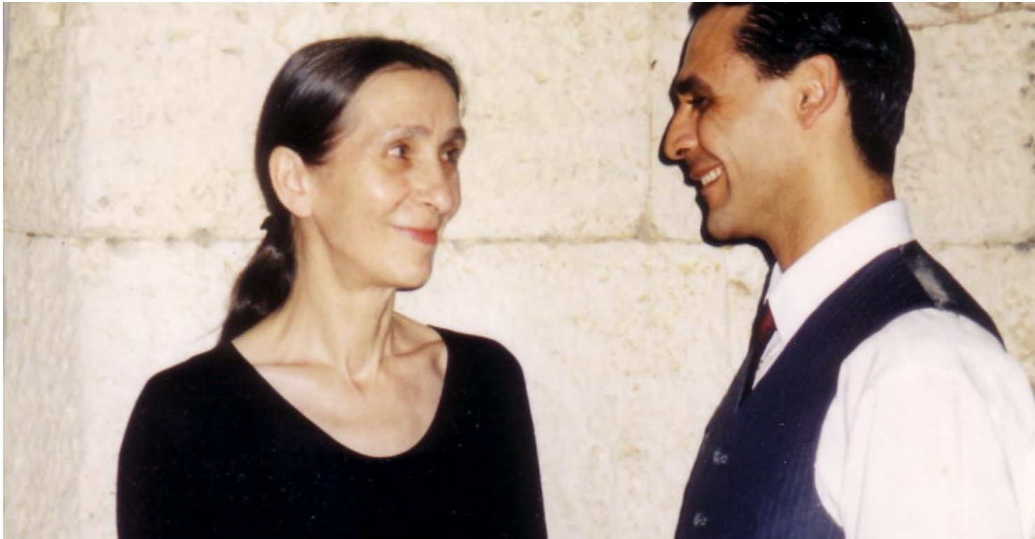
Από το 1989 ως το τέλος της ζωής της η Πίνα Μπάους είχε δίπλα της τον Δάφνι Κόκκινο ως ιδανικό χορευτή της αλλά βοηθό της στο σύμπαν που έφτιαξε

Εφυγε για πρώτη φορά από το ορεινό χωριό στην Κρήτη στα 15 του χρόνια. Στα 20 του είδε την Πίνα Μπάους στο Ηρώδειο και είπε «αυτό μόνο θέλω στη ζωή μου». Δεκαετίες μετά αφού χόρεψε σε κορυφαία θέατρα και έγινε το δεξί χέρι της ιέρειας του σύγχρονου χορού, εγκαταλείπει τις μεγάλες σκηνές της Ευρώπης γιατί όπως λέει «με καλεί το καθήκον»: αναλαμβάνει την Κρατική Σχολή Ορχηστρικής Τέχνης.