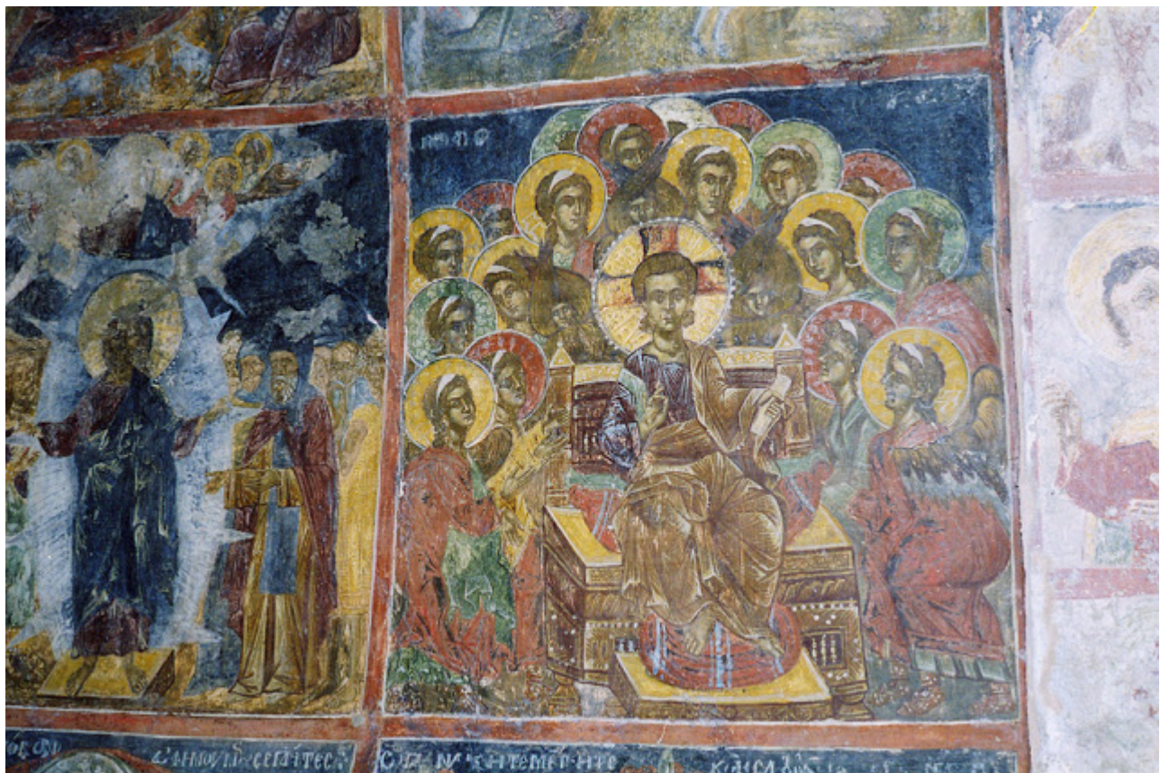
Αποψη των τοιχογραφιών.