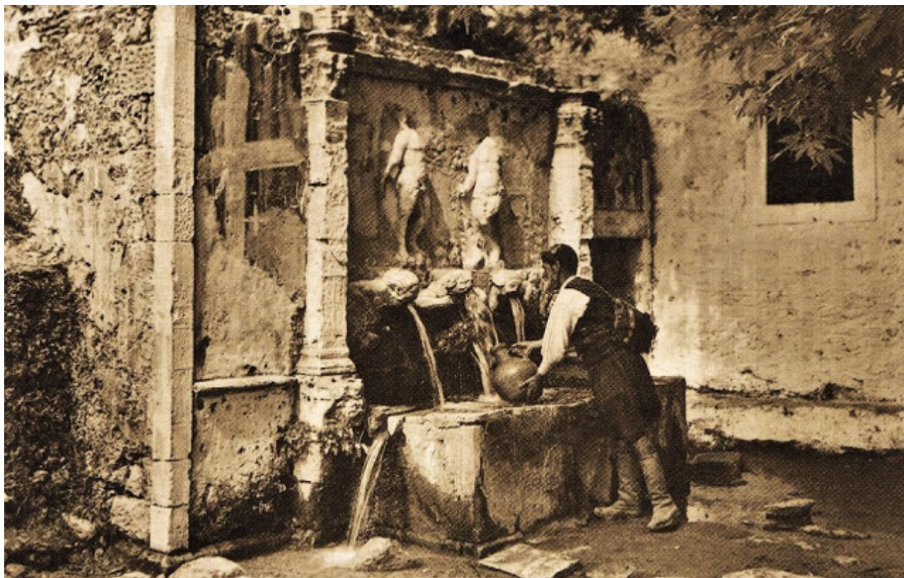
Η Κρήνη της Μονής το 1939.

Η παλαιά είσοδος έχει αντικατασταθεί, διατηρούνται όμως ευδιάκριτα λείψανά της, ενώ το καθολικό είναι δίκλιτος, διμάρτυρος ναός με το ένα κλίτος είναι αφιερωμένο στον τιμώμενο άγιο της Μονής Αντώνιο και το δεύτερο στον απόστολο Θωμά.