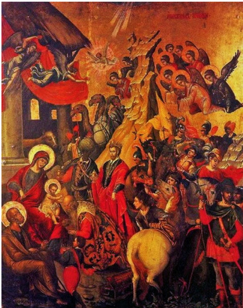
Μιχαήλ Δαμασκηνός, Η Προσκύνησης των Μάγων. Μουσείο Ιεράς Αρχιεπισκοπής Κρήτης πηγή