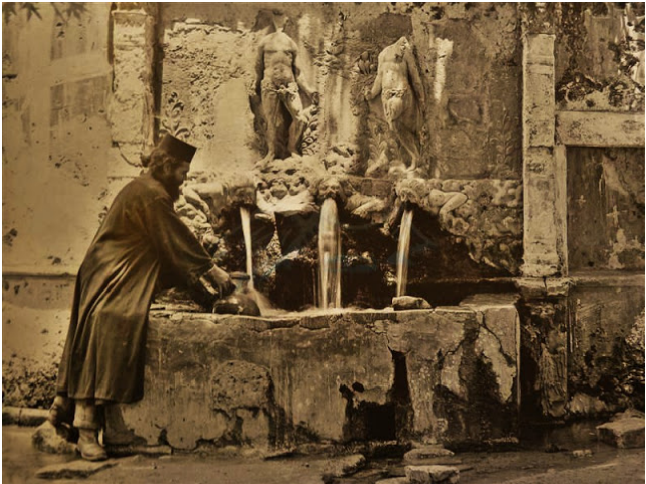
Η Κρήνη της Μονής, 1935.

Η κρήνη αυτή θεωρείται το ωραιότερο δείγμα επαρχιακής κρήνης στην Κρήτη και για αυτό οι Τούρκοι ονόμαζαν το Βροντήσι ως Σαντριβανλί μοναστήρι.