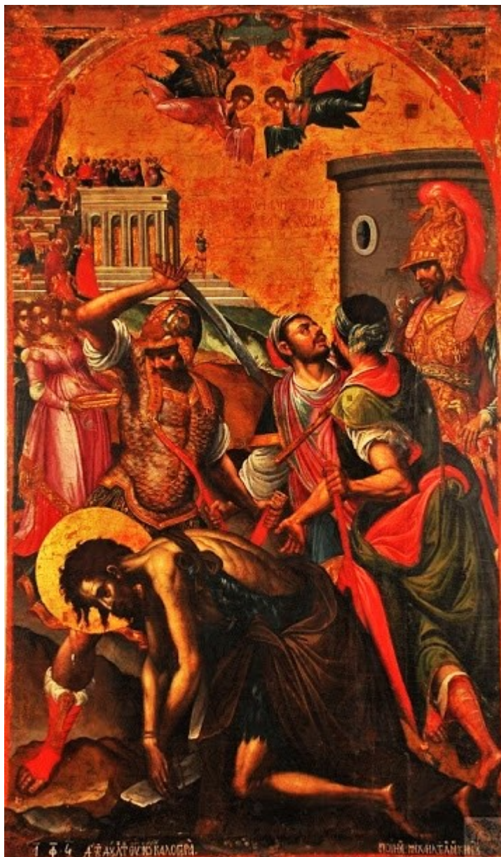
Μιχαήλ Δαμασκηνός, 1590 Η Αποτομή του Αγίου Ιωάννου του Προδρόμου. Μουσείο Ιεράς Αρχιεπισκοπής Κρήτης πηγή

Μπορούμε μόνο όμως να υποθέσουμε ότι κατέφυγε στο Βροντήσι, κοντά σε άλλους λογίους της εποχής, αναζητώντας μια ψυχική επαφή μαζί τους, αλλά και επαφή με την τέχνη που είχε ενδεχομένως αναπτυχθεί σε σημαντικό βαθμό, στο μοναστήρι, εκείνη την εποχή.