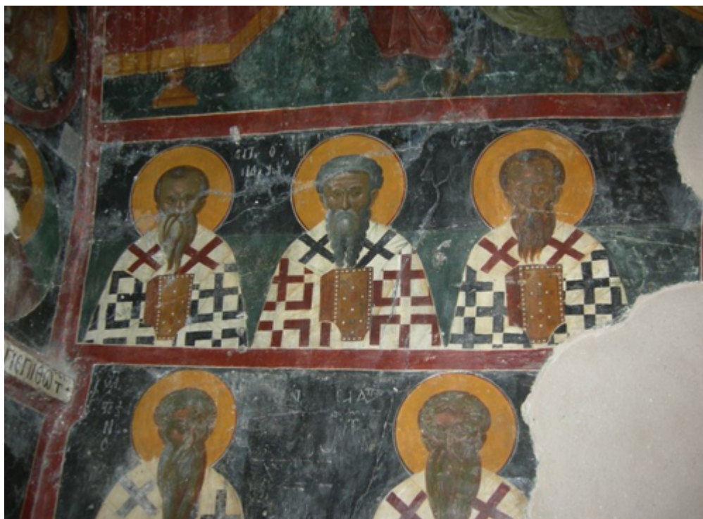
Αποψη των τοιχογραφιών.