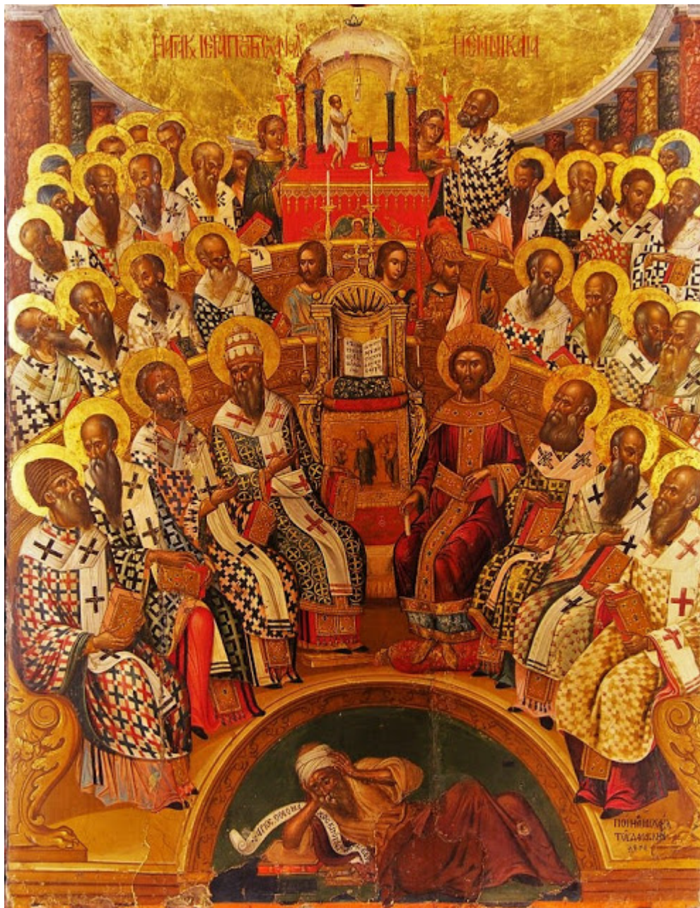
Μιχαήλ Δαμασκηνός, Η Α οικουμενική Σύνοδος.

Οι εικόνες αυτές μαρτυρούν τη σχέση που είχε ο περίφημος αυτός ζωγράφος με τη Μονή Βροντησίου και δεν ήταν καθόλου παράξενη αυτή η σχέση, αφού το Βροντήσι ήταν γνωστό πνευματικό κέντρο της Ενετοκρατούμενης Κρήτης όμως δεν είναι γνωστό ποια ακριβώς ήταν η σχέση του Δαμασκηνού με τη Μονή Βροντησίου.