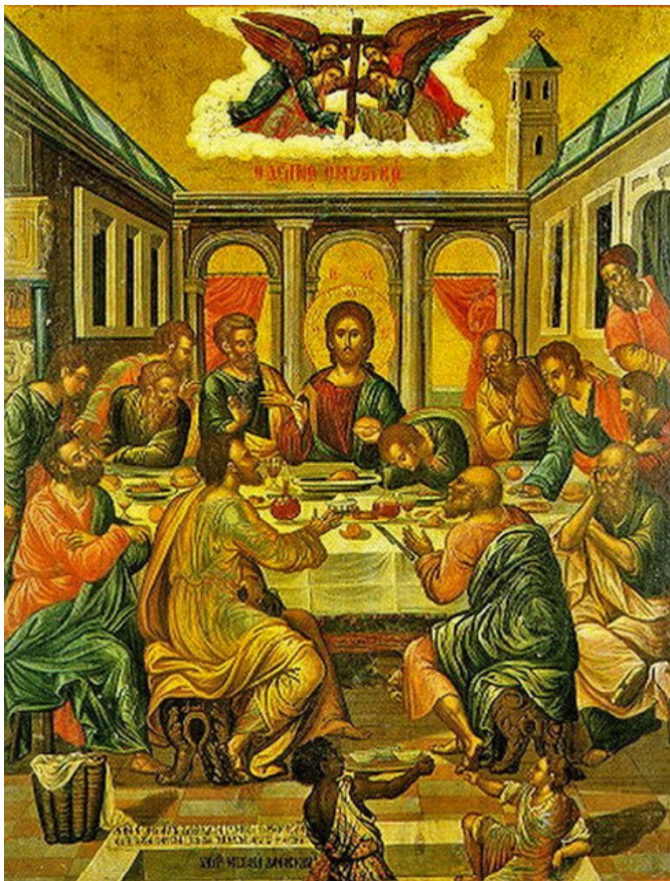
Μιχαήλ Δαμασκηνός, Ο Μυστικός Δείπνος. Μουσείο Ιεράς Αρχιεπισκοπής Κρήτης