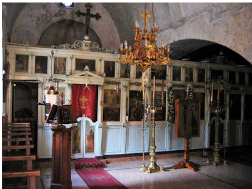
Άποψη του τέμπλου του Καθολικού. πηγή

Ωστόσο στην επανάσταση του 1866 τέσσερις από τους μοναχούς σφαγιάστηκαν, το καθολικό και 10 από τα κελιά κάηκαν και οι αγροτικές καλλιέργειες της μονής μεταξύ αυτών περίπου 300 ελιές πυρπολήθηκαν, επειδή έδωσε καταφύγιο στους επαναστάτες του Μιχαήλ Κόρακα.