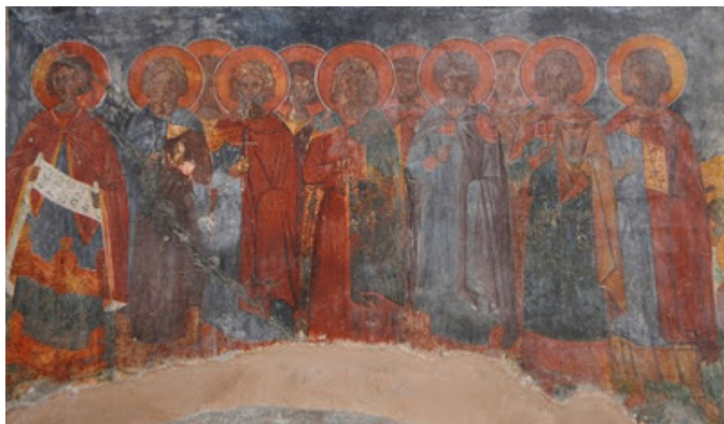
Άποψη των τοιχογραφιών πηγή

Μια εκπληκτική όμως μαρτυρία για τη σχέση του Μιχαήλ Δαμασκηνού με τη Μονή του Αγίου Αντωνίου Βροντησίου, προέρχεται από κάποια ενθύμηση που δημοσίευσε ο καθηγητής Μ. Μανούσακας.