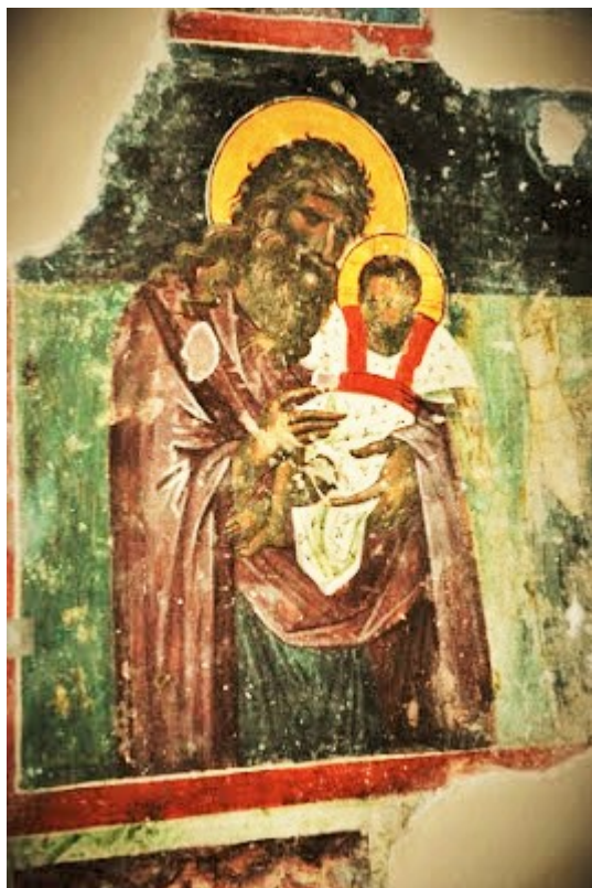
Ο Άγιος Συμεών ο Θεοδόχος που κρατά στην αγκαλιά του το βρέφος Ιησού.