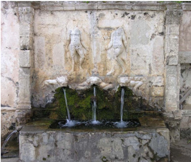
Η περίτεχνη ανάγλυφη Κρήνη του 16ου αιώνα, της Μονής Βροντησίου.

Από την καταστροφή αυτή, σώζονται ελάχιστες από τις τοιχογραφίες του ναού, όμως στις μέρες μας αν και η μονή έχει χάσει την παλιά της αίγλη, εξακολουθεί να είναι επιβλητική.