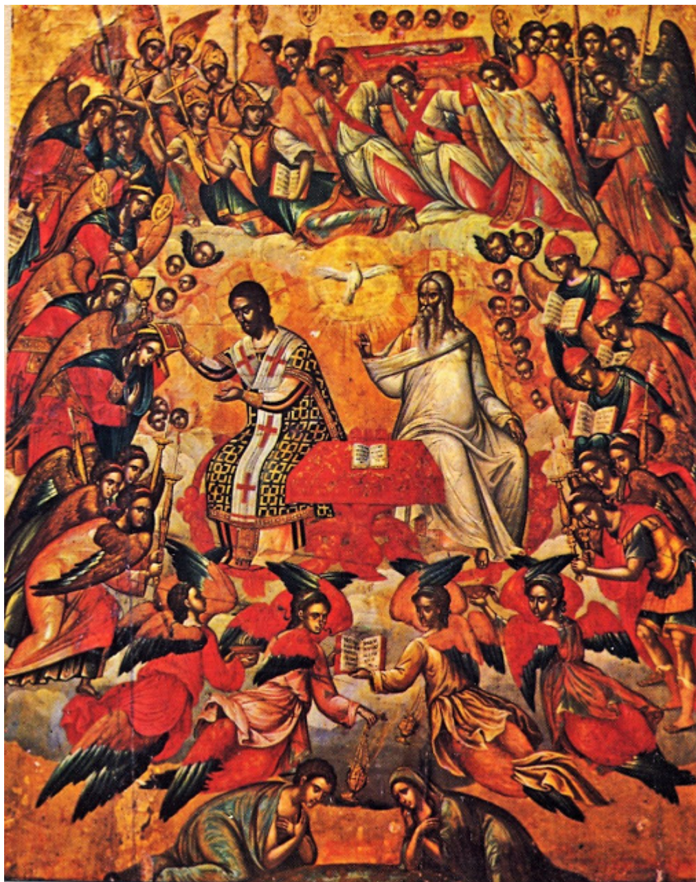
Μιχαήλ Δαμασκηνός Φορητή εικόνα με θέμα την Θεία Λειτουργία (1579 - 1584). Μουσείο Ιεράς Αρχιεπισκοπής Κρήτης.