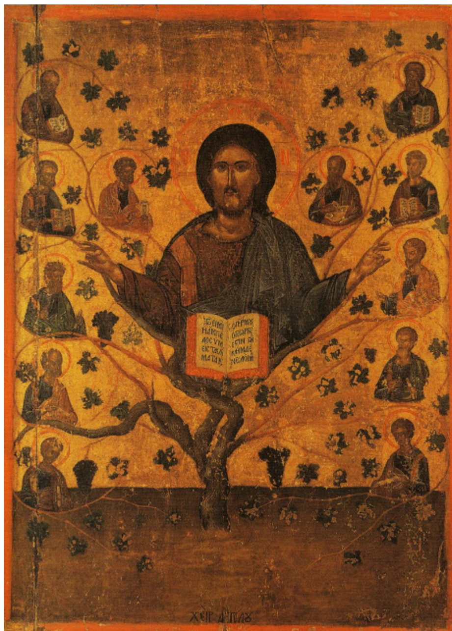
Άγγελος Ακοτάντος, Η Άμπελος.

έργο του μεγάλου και σπουδαιότερου κρητικού ζωγράφου του 15ου αιώνα, Άγγελου Ακοτάντο από τον Χάνδακα. Σήμερα στη μονή, σε κτίριο δυτικά της εξωτερικής αυλής στεγάζονται προσωρινά οι δραστηριότητες του Διεθνούς Χωριού Κρητικής Νεολαίας.