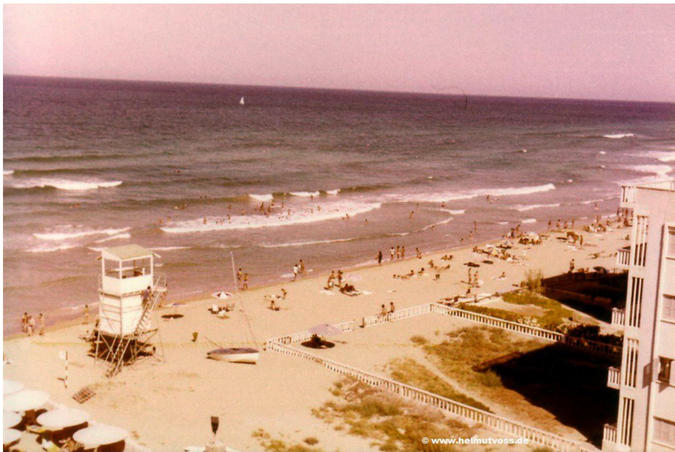
Θέα από το 4στερο ξενοδοχείο Αστερίας