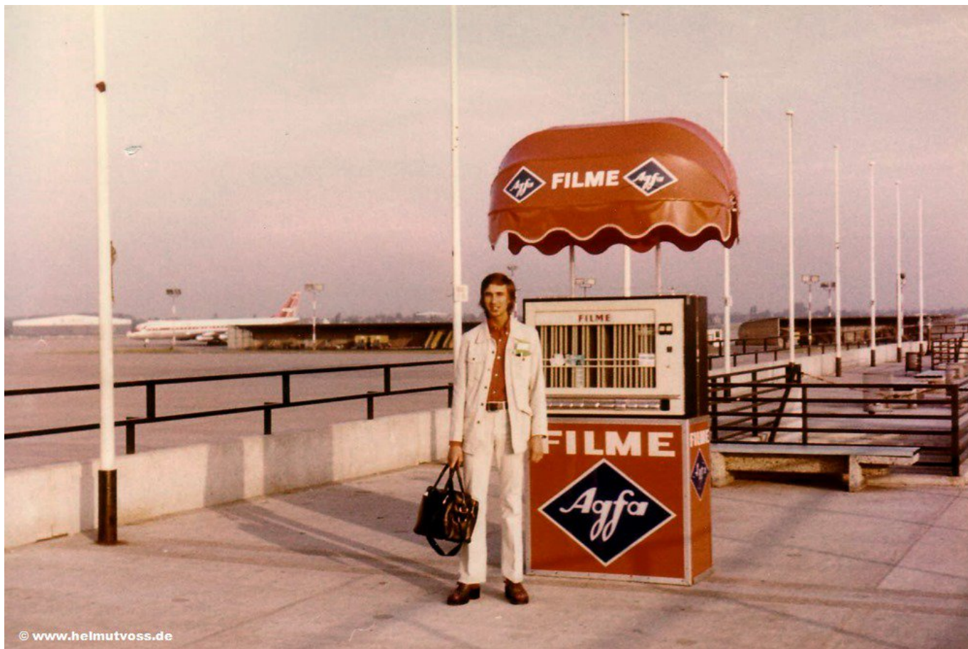
Λίγο πριν την επίσκεψη στις ονειρεμένες παραλίες της Αμμοχώστου