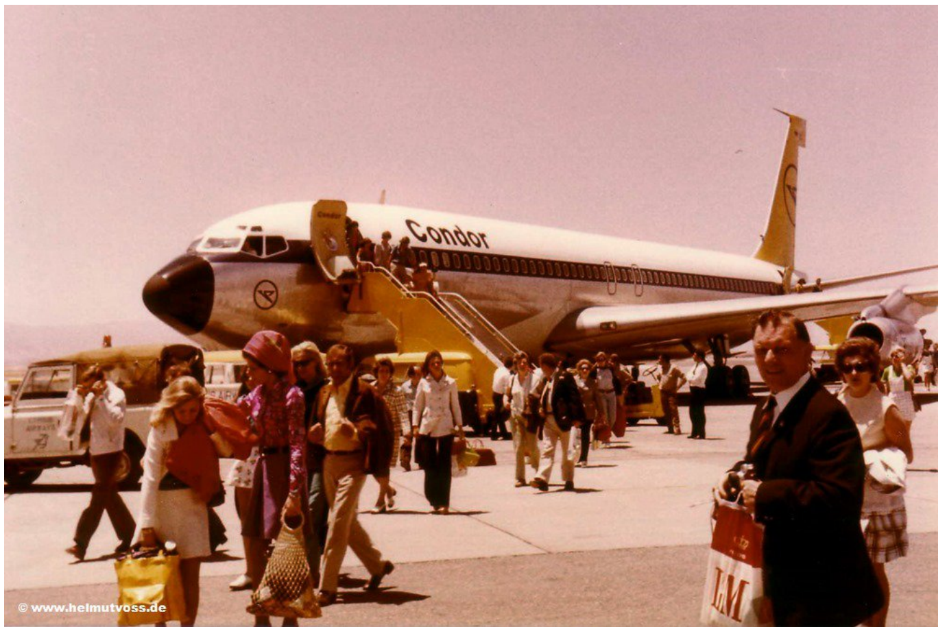
Άφιξη στο νησί της Αφροδίτης