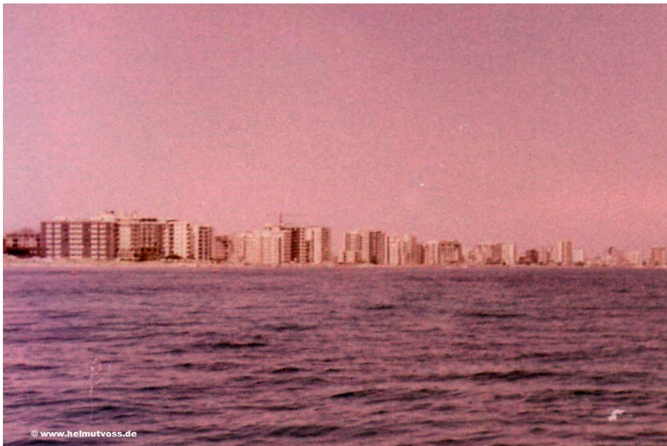
Τα υπέροχα Βαρώσια