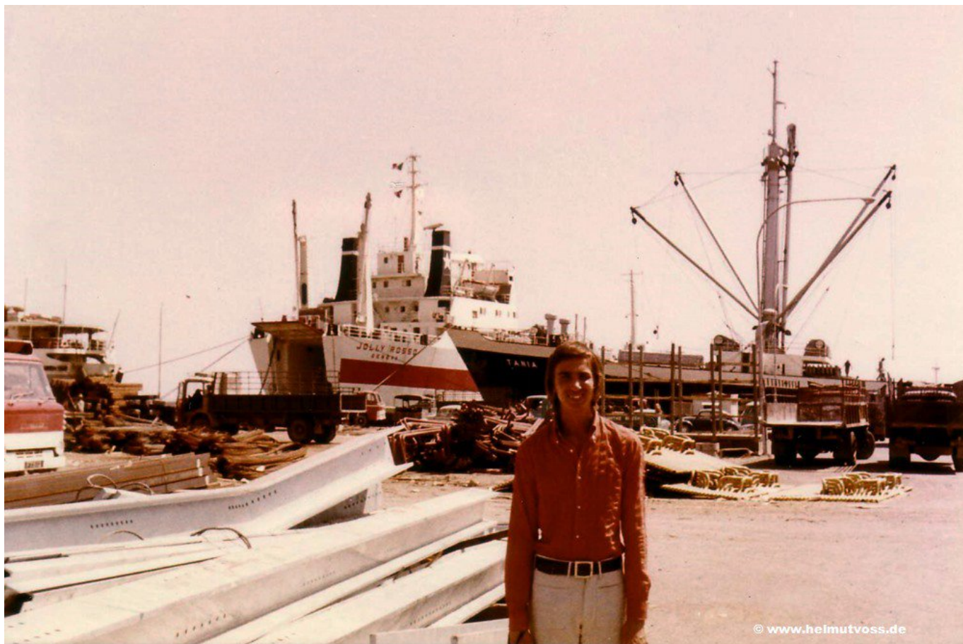
Το λιμάνι της Αμμοχώστου