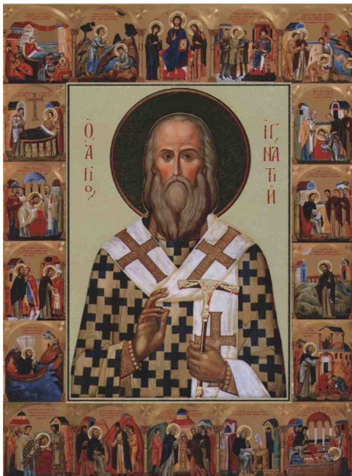
Όσιος Ιγνάτιος (Μπριαντσανίνωφ), Επισκοπος Σταυρουπολεως (1807-1867).

Συνέχεια από εδώ: http://www.diakonima.gr/?p=497401