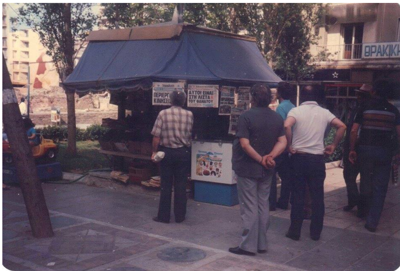
Πλατεία Ναυαρίνου, 1984 εικόνα Νίκος Γιαννακόπουλος

Τι έκανε τυπικά ένα παιδί του κέντρου στη δεκαετία του '80; «Ξεκινούσαμε από ένα καφέ στην Πλατεία Ναυαρίνου, συνεχίζαμε σε μαγαζιά με ηλεκτρονικά παιχνίδια arcade games, με φλιπεράκι ή ποδοσφαιράκι σε μαγαζιά πάνω και κάτω από την Εγνατία και καταλήγαμε για ποτό κάτω στην Παραλία».