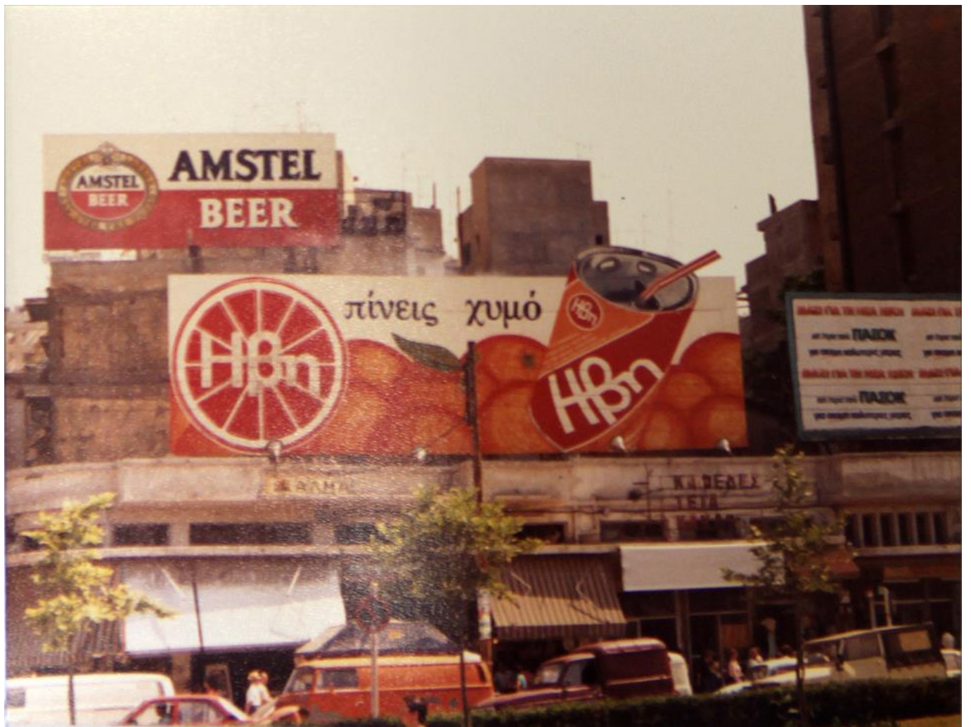
Πλατεία Δημοκρατίας με αρκετές διαφημιστικές πινακίδες