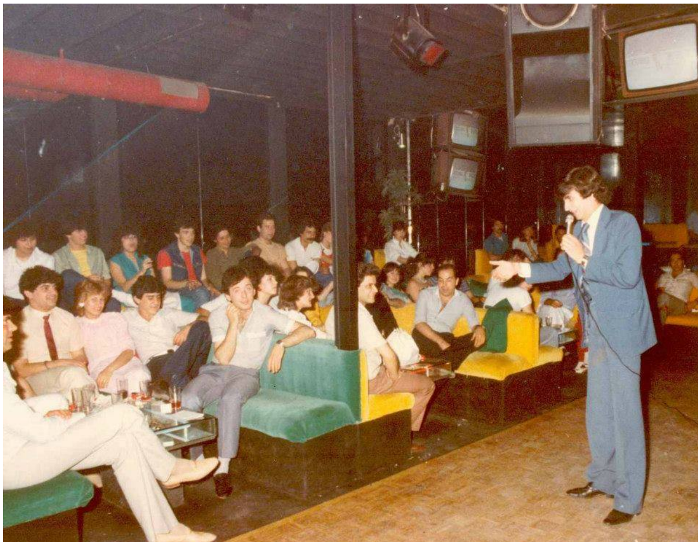
Stand up comedy δεκαετίας 80, στο πρόγραμμα της Disco Studio 51 επί της Προξένου Κορομηλά. 1985.